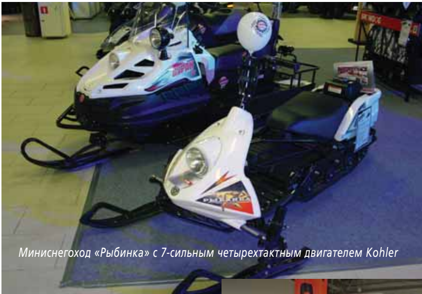
Миниснегоход «Рыбинка» с 7-сильным четырехтактным двигателем Kohler

это транспортное средство довольно трудно – от 0 до 60 км 800-килограммовый монстр разгоняется всего за 5 секунд. Что совсем не удивительно, ведь аппарат оборудован 2.4-литровым 173-сильным движком GM. Точно такие эта американская компания раньше ставила на некоторые модели автомобилей Pontiac и Saturn. Пятиступенчатая коробка передач и цена (на американском рынке начинается от 20 000 долл.) еще больше роднят с машинами эту «полярисовскую» новинку 2015 г.