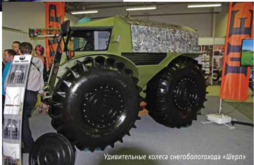
Удивительные колеса снегоболотохода «Шерп»

в этом сегменте косолапых Yamaha. Их ATV 400 EFI стоит всего 240 000 руб. Говорят, что и подвесные моторы калининградцев можно купить очень дешево (18-сильный двухтактник, сделанный по технологии Selva – за 72 000 руб). Качество и того, и другого нам пока не известно, зато эмблема фирмы смотрится один в один как канадской BRP. Кстати, о канадцах – одна из самых больших экспозиций в «Гардене» представляла зимнюю туристическую одежду Kimpex из Страны кленового листа. Учитывая, что рядом с комбинезонами и штормовками постоянно гремела зажигательная музыка, под которую стройные русалки в бикини все время отплясывали ча-ча-ча, было не очень понятно, на что больше косил глаз народ – то ли на Kimpex, то ли на бикини.