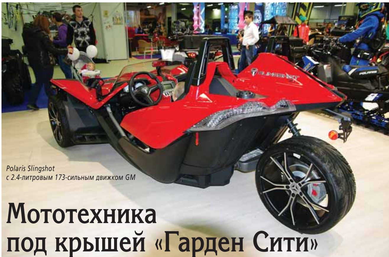
Polaris Slingshot с 2.4-литровым 173-сильным движком GM