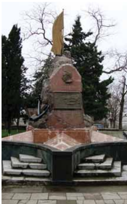
Могила Петра Шмидта в Севастополе и обелиск в память расстрелянных «очаковцев» на острове Березань