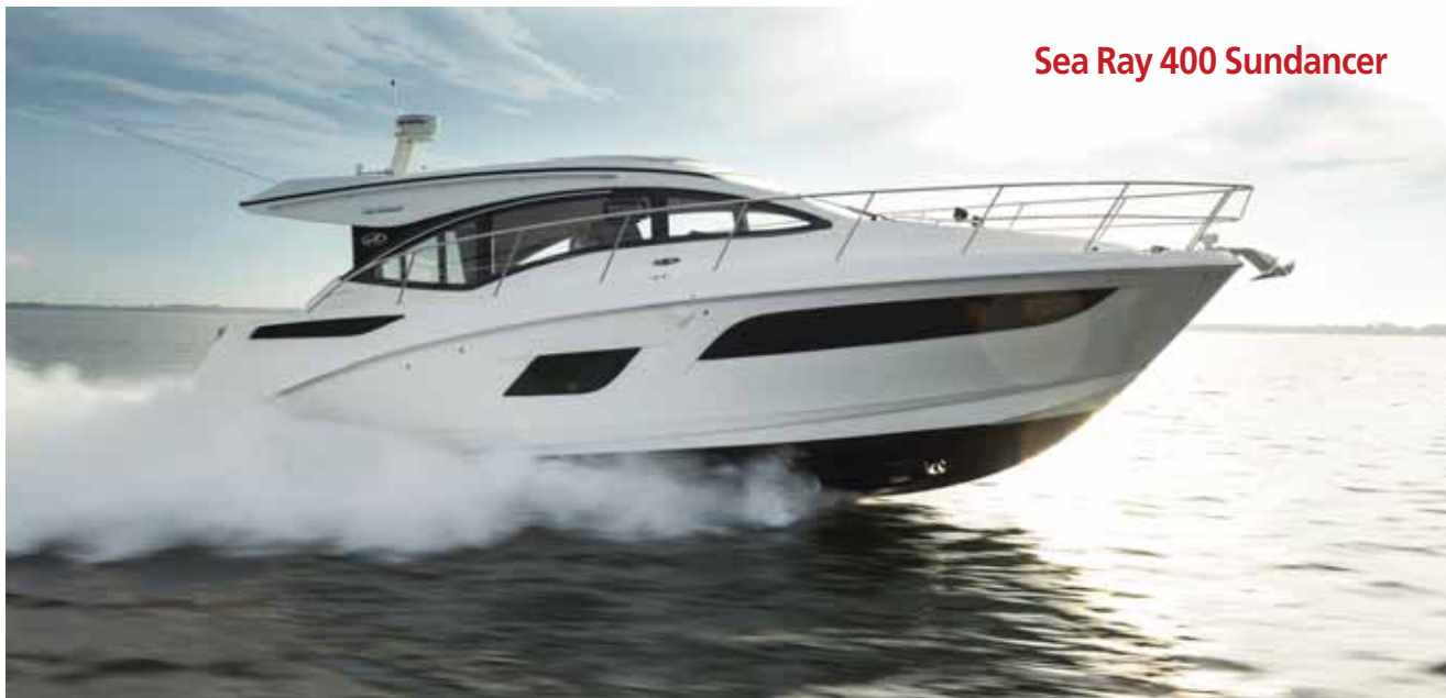
Sea Ray 400 Sundancer

полняется естественным светом, обеденная зона и автоматический люк. В носовой части расположен удобный солярий с лежаками для принятия солнечных ванн.