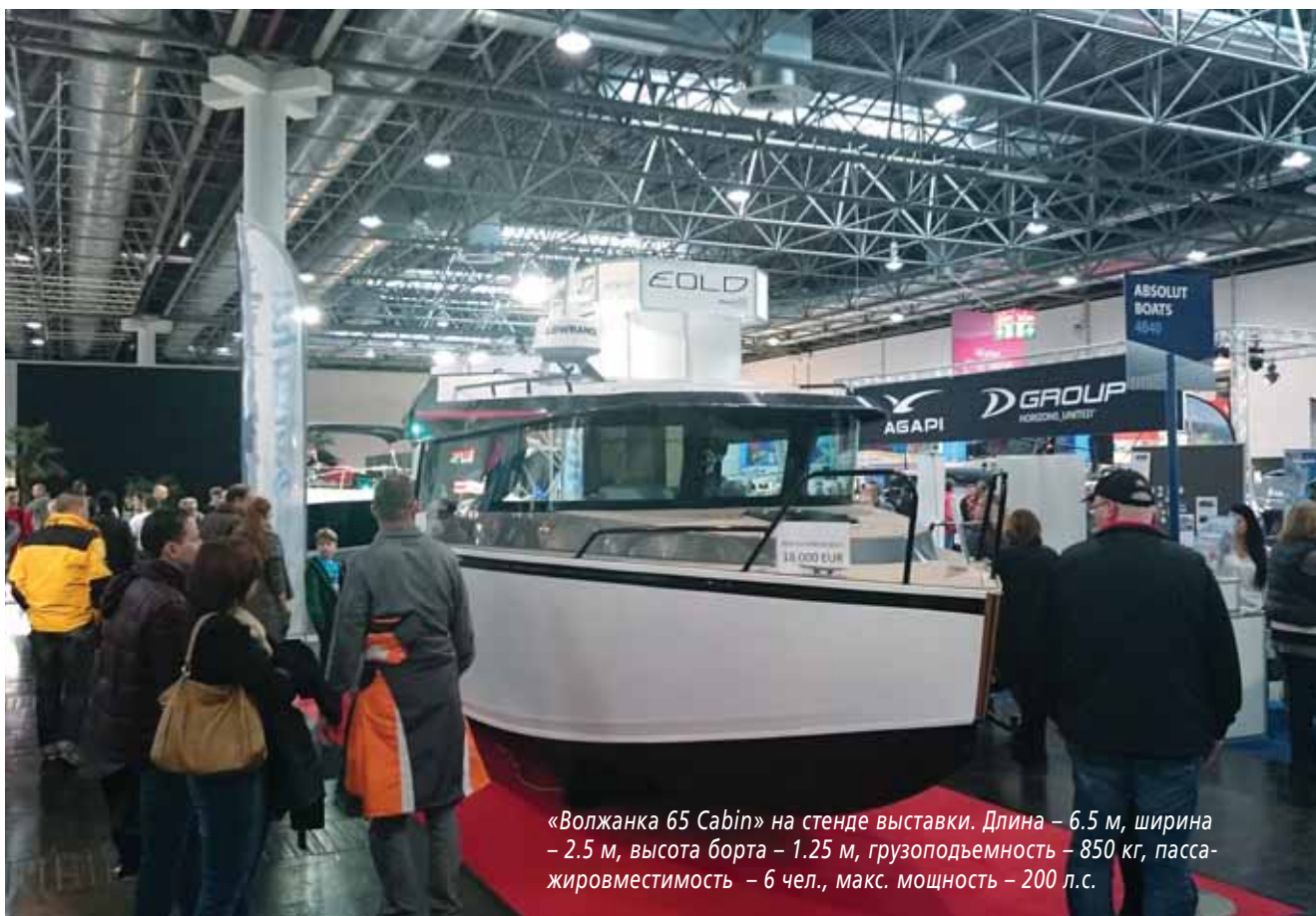
«Волжанка 65 Cabin» на стенде выставки. Длина – 6,5 м, ширина – 2,5 м, высота борта – 1,25 м, грузоподъемность – 850 кг, пассажироместность – 6 чел., макс. мощность – 200 л.с.

После нескольких лет затишья европейцы вновь почувствовали тягу к морским просторам и водному спорту и, согласно итоговому отчету организаторов выставки, наибольшая покупательская активность наблюдалась в павильо-