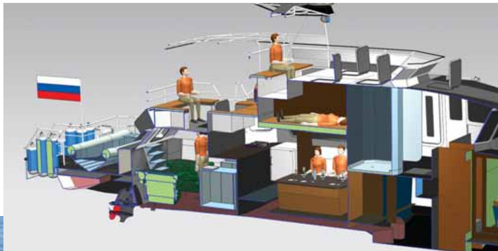
На круизной скорости 48 км/ч

В 1992 г. в Иркутск пришли два 14-метровых алюминиевых водометных катера на газовой каверне типа «Сайгак» пр. 14081 (в них применялось наполнение воздушной каверны выхлопными газами двигателя, а не специальными нагнетателями). Разработчик – петербургское КБ «Редан», катера были построены на ССЗ «Кама» в Перми, оснащались дизелями М401 в 1100 л.с. завода «Звезда», аналогичными тем,