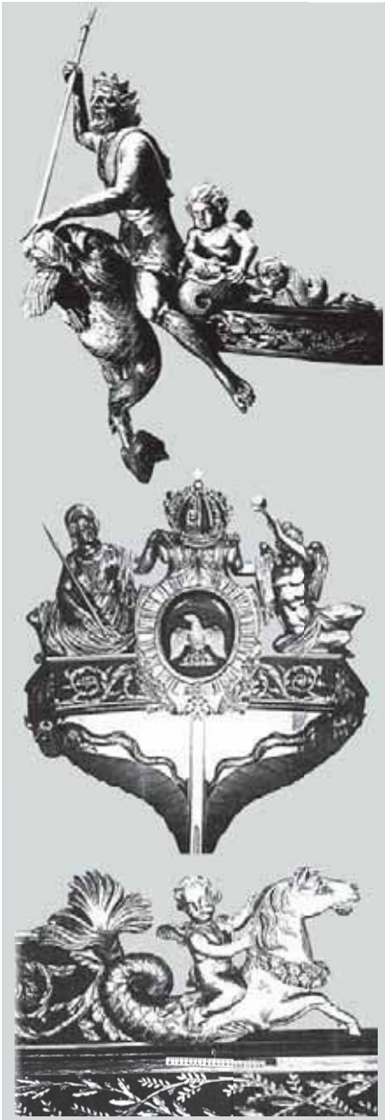
Фрагменты декоративного убранства катера