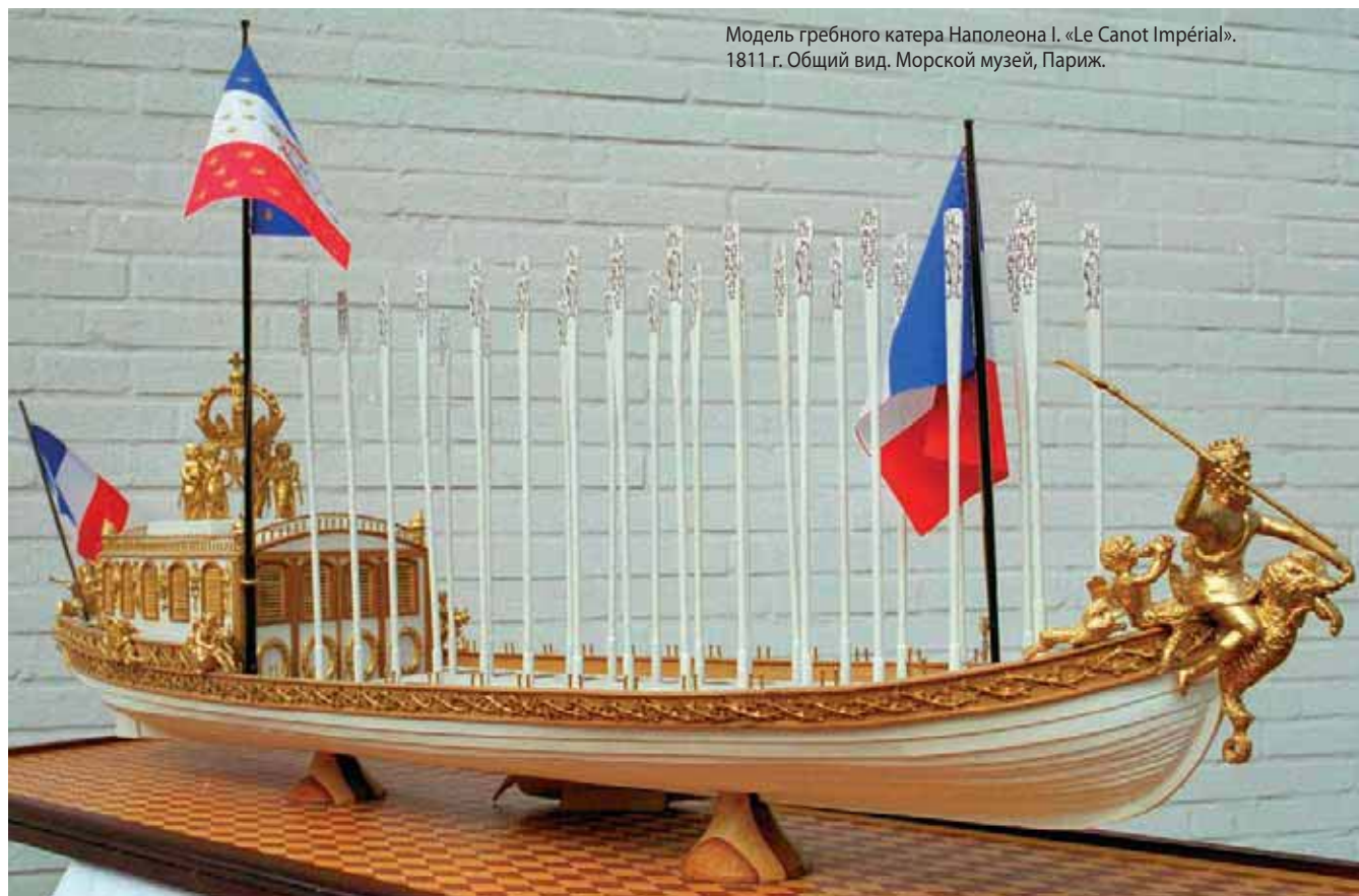
Модель гребного катера Наполеона I. «Le Canot Impérial». 1811 г. Общий вид. Морской музей, Париж.