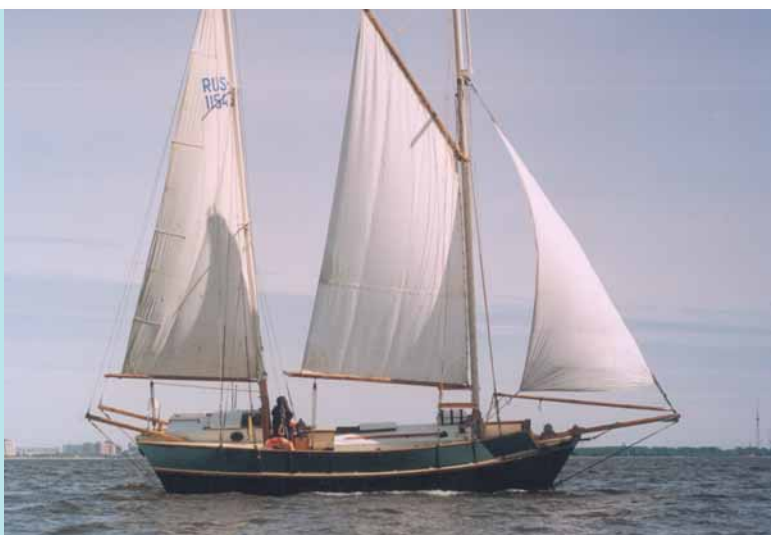
Шхуна “Самба” выходит в залив

В 1999 г. в Санкт Петербурге были заложены и в 2002 г. спущены на воду шхуны “Самба” (капитан С.И. Афонин) и “Три звездочки” (капитан А.Б. Плешков). За основу был взят проект бригантины “Старина” из “Кия”. Яхты строились для длительных круизных походов. Парусное вооружение шхуны (в отличие от бригантины) позволило свести количество снастей для подъема и управления парусами к минимуму. По отзывам капитанов, тип судна был выбран удачно: большие объемы помещений, длинный киль, позволяющий отвлекаться от штурвала, высокий борт — все способствует переходам в любую погоду. Шхуна “Самба” в 2002 г. совершила переход С.-Петербург–Лиссабон–Канарские острова, шхуна “Три звездочки” неоднократно ходила в Швецию, Данию и Финляндию.