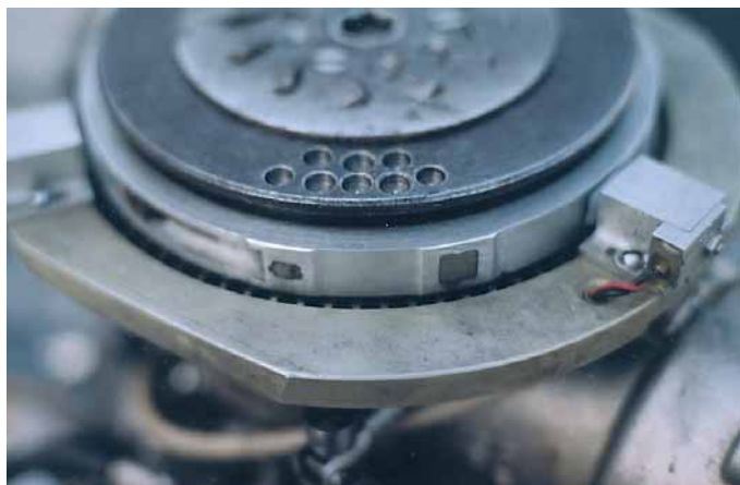
Два магнита автоматического опережения. На маховике – отверстия балансировки.