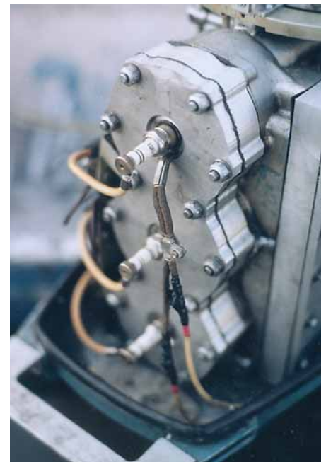
Головка блока цилиндров “Симбиоза-55”. На переднем плане — провода термодатчика от верхней свечи