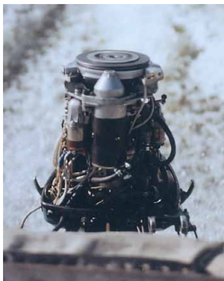
За кормой «ПРОГРЕССА-4» — пена и брызги: «55-й» демонстрирует все, на что способен

Итог: при меньшем объеме «Изделие-40» потребляет топлива больше на повышенных оборотах. При штатных 5000 об/мин мощность его составляет 35.7 л.с. Единственное его преимуще-