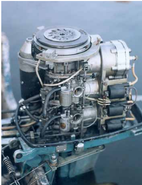
“Симбиоз-55”: вид со стороны глушителей (слева) и со стороны карбюратора

ство перед трехцилиндровым “Бийском-45” — это вес. На первый взгляд.