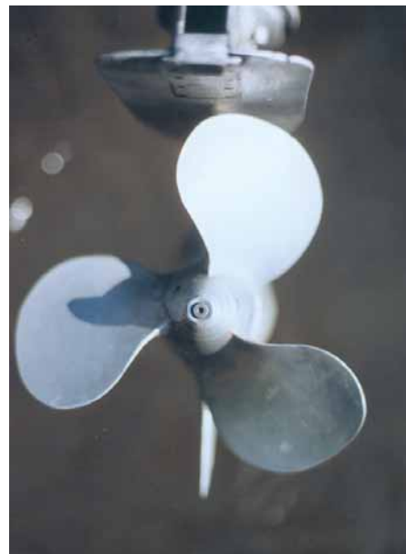
Гребной винт от «Вихря-30» с развернутыми лопастями, H = 350 мм

Итак, мощность «Изделия-40» — 42.1 л.с., а «Бийска-45» — 45 л.с. Оба двигателя имеют клапанное газораспределение, по отдельному карбюра-