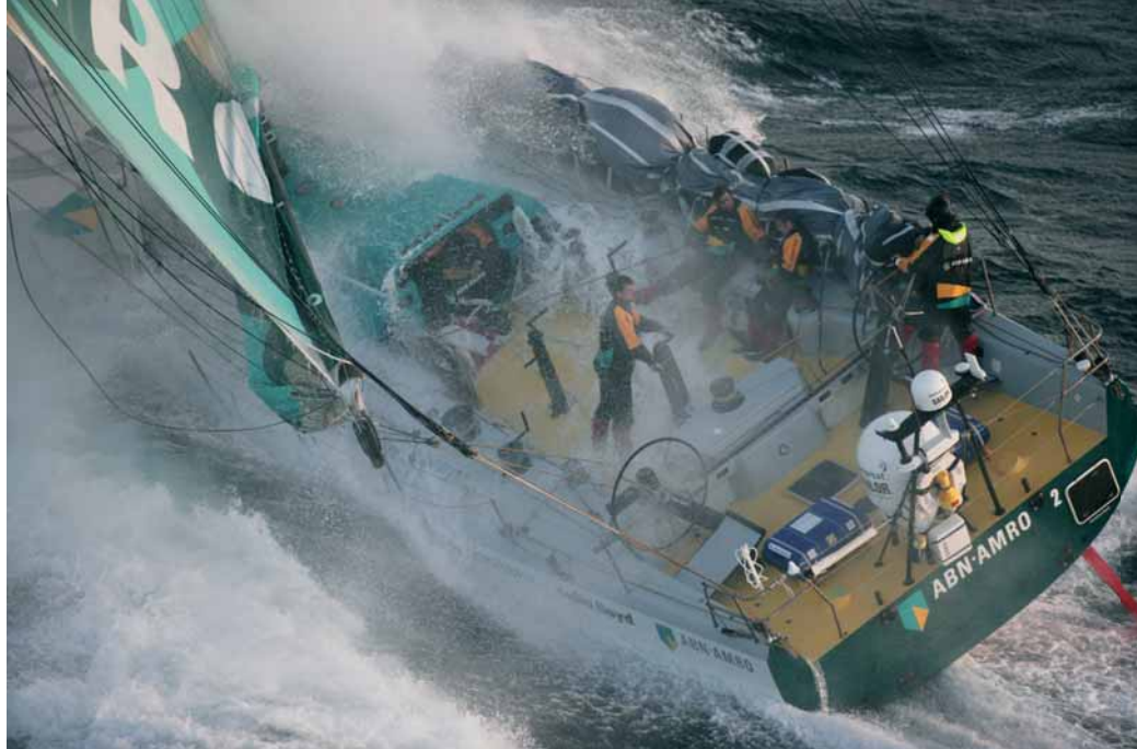
Яхта «ABN Amro Two» в гонке «Volvo Ocean Race».