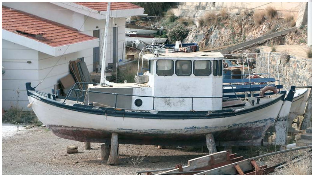
Город Агиос Николаус, о. Крит. Так рыболовные суда ждут ремонта в марине.