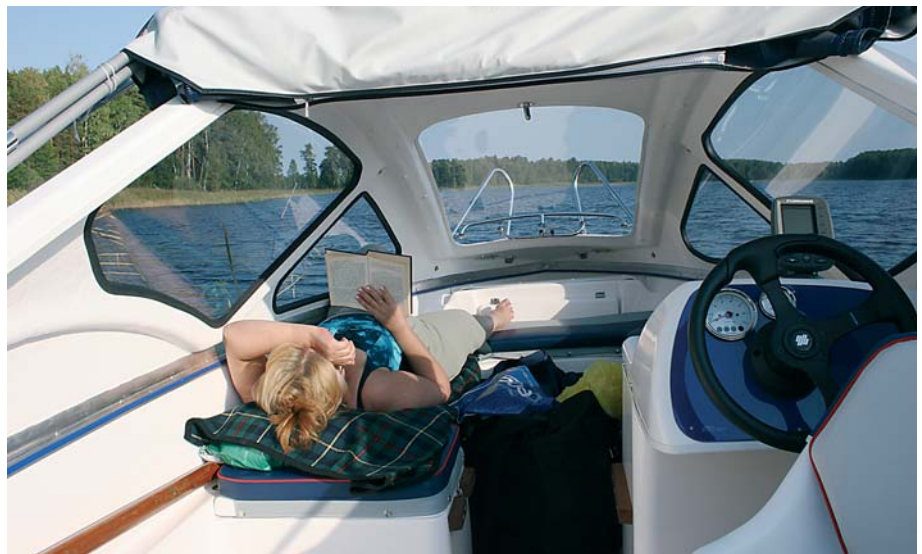
В рубке на левом диване можно лежать в полный рост

Открываю крышки диванов и заглядываю внутрь – тесновато. В рубке четыре закрываемых защелкой багажника, один из них полностью занят аккумуляторным боксом (удобно), а во втором на самом емком месте закреплен почему-то огнетушитель; не лучше ли его иметь под рукой в нише пульта управления! Есть еще открытый носовой отсек, куда можно убрать якорь и буксирный конец. Пытаюсь убрать в свободные рундуки походное снаряжение троих испытателей. Не сразу, но