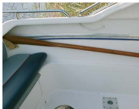
Единственное место, где можно хранить весло-гребок, но держателей здесь нет

прокормишь. Из воды в лодку можно подняться по стальному складному трапику, который на ходу поднимается.