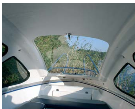
Передняя стойка ограничивает обзор водителя