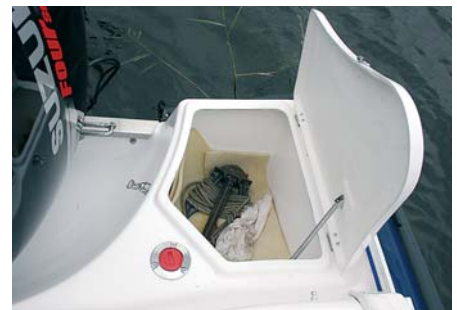
Крышка кормового багажника на пружинном фиксаторе прикрывает заливную горловину