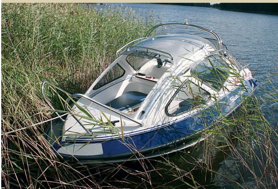
Подняв лобовое стекло, можно получить открытый носовой кокпит

Все, что не хочется тащить с собой в кокпит – черпак, ведро, инструмент, ветошь, воронку, банку с маслом – помещается в два кормовых багажника. Сюда же можно убрать и кормовой якорь. Крышка левого багажника прикрывает и пробку заливной горловины. Так, от недоброжелателей... Сварной из алюминия стационарный бак на 105 л – не опция, а стандартная комплектация. Действительно, штатным бачком 115 лошадей долго не