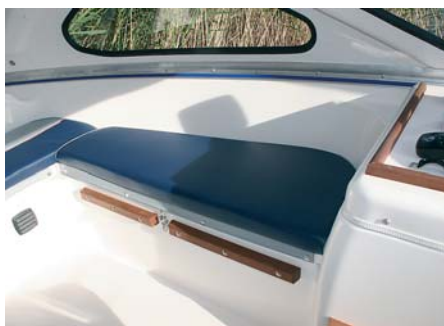
Отделка красным деревом очень украшает интерьер рубки. Бруски вдоль стенок диванов одновременно служат упором для спального места

лодка держит неохотно, приходится подруливать.