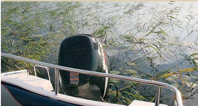
Высота кормового релинга нам показалась чрезмерной