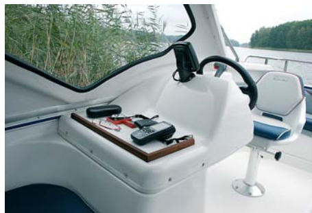
Удобный «штурманский» столик перед местом водителя