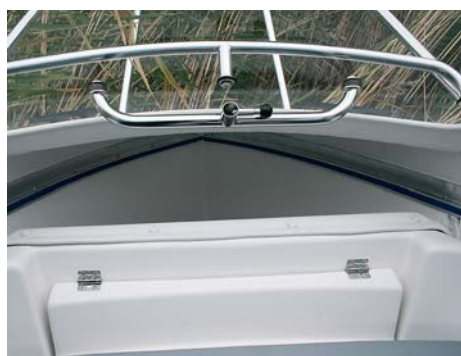
Система поручней для подъема стекла. В носу – открытый якорный ящик.