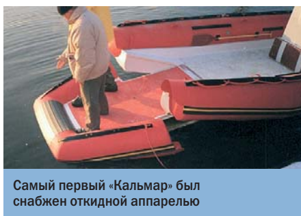
Самый первый «Кальмар» был снабжен откидной аппарелью

мягкой пленки тента на жесткий плексиглас улучшилась обзорность. Отказ от трех секций ходового тента и изменения в системе растяжек существенно повысили его прочность. Конструкция силового каркаса «хардтопа» полностью переработана с целью повышения ее жесткости. Бортовые рундуки на палубе подняты на 15 см от уровня пайола, что позволило увеличить их емкость и исключить вероятность заливания.