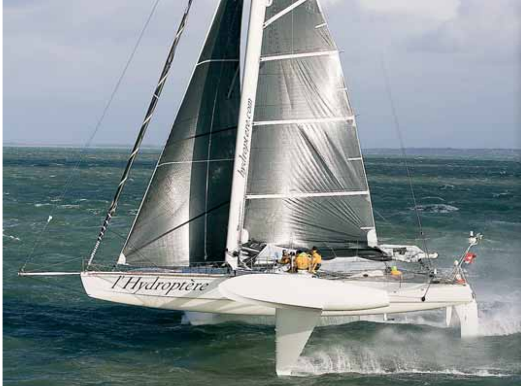
Тримаран на подводных крыльях «L'Hydroptère» в попытке установить абсолютный рекорд скорости под парусами.