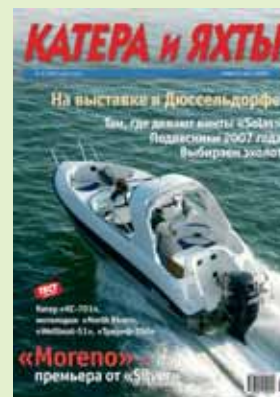
На обложке: моторная лодка «Silver Moreno».

Подписка через редакцию – с любого номера!