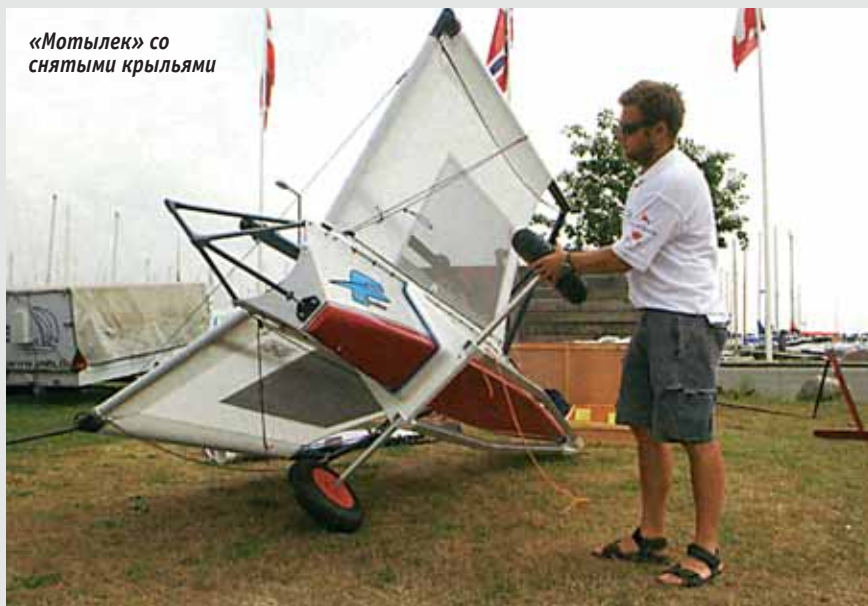
«Мотылек» со снятыми крыльями