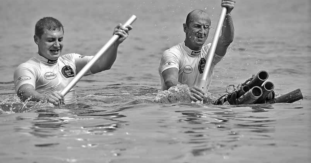
Момент соревнования «Rubson Raid Turquoise», проходившего в Таиланде.