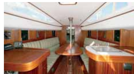
Интерьер «930-го» — ну и чем он хуже западных лодок?