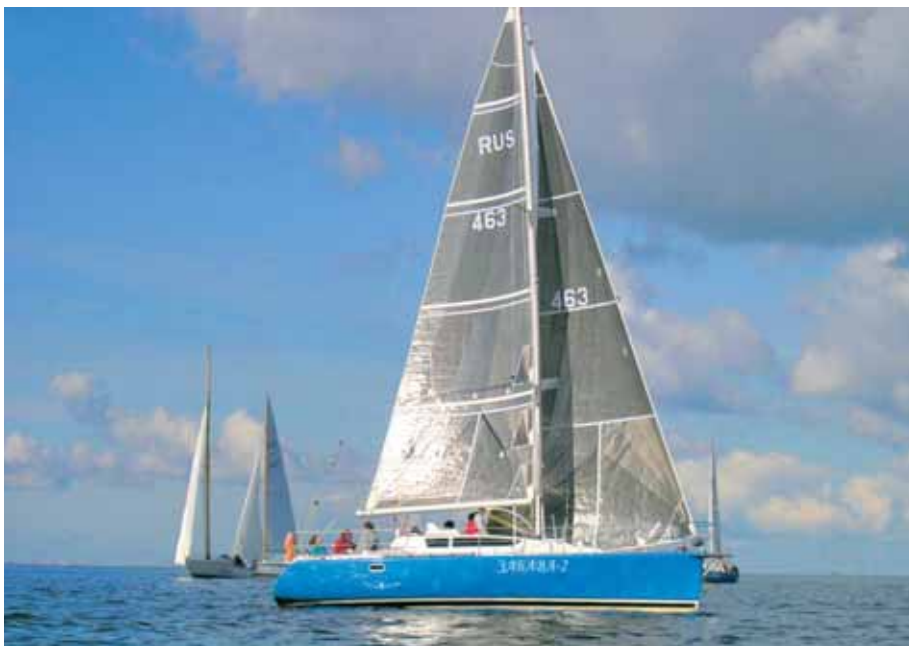
«Рикошет 930» на чемпионате Петербурга 2005 г.

безопасности. Энерговооруженная, но не до потери здравого смысла. Спортивная, но не до фанатизма. Функциональная, но не отменяющая таких понятий, как дизайн, стиль и комфорт. И всегда изящная и узнаваемая. Пожалуй, так можно сформулировать нашу концепцию. В настоящее время появилась целая гамма таких яхт, которые в той или иной степени близки этой идее. Особенно среди серийных 40–50футовых яхт типа «Swan 45», «Dehler 44», «DK 46» (№ 202), «X 41» и, разумеется, «Рикошет 1220».