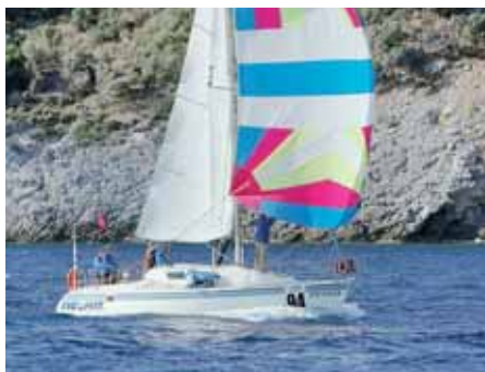
«Рикошет 940» — серебряный призер регаты в Мармарисе