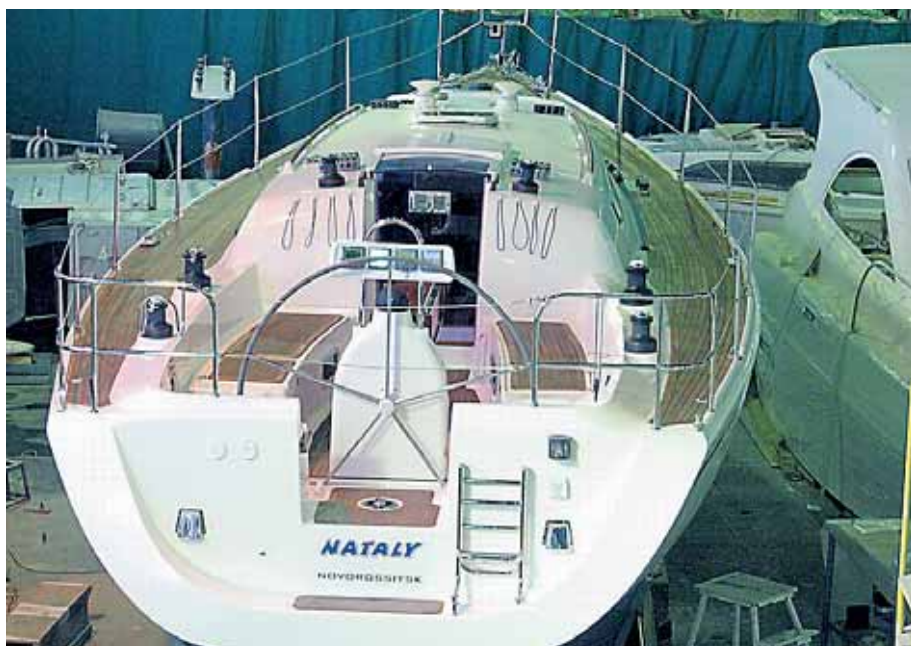
Кокпит «Рикошета 1220». Солидно!