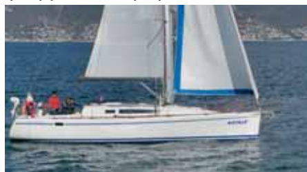
«Рикошет 1220» на ходовых испытаниях