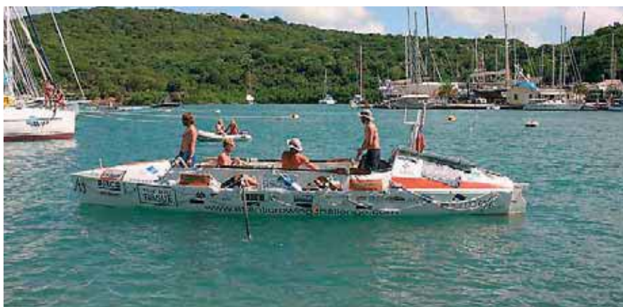
Победитель в общем зачете – английская четверка «белых воротничков» «Pura Vida» под «несчастливым номером» 13

Заметим, что наряду с гонками (а они проводились только в Атлантике), в трех океанах планеты совершали гребные марафоны и самодеятельные энтузиасты (109 лодок). Без преувеличения, это были подвиги в океане – иные находились на маршруте более полугода. Однако проведение организованных гонок резко повысило эффективность вояжей и