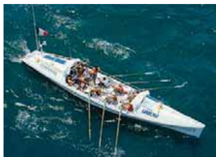
1992 г. «Галера» «La Mondiale» под французским флагом ставит мировой рекорд пересечения Атлантики.

четверка из Плимута «Queensgate» (не хватило 16.5 часов) и в 2005 г. четверка «All Relative» (не хватило более четырех суток). Ну как после стольких неудач было не появиться новым претендентам? Они объединились в специальной гонке «Transatlantic Rowing Record Race», стартовавшей 15 декабря 2007 г.