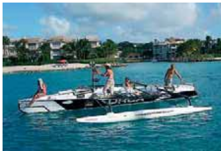
Первая в мире трехкорпусная лодка для покорения океана на веслах – 9-метровая «четверка» «ORCA»