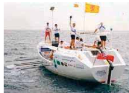
15-метровая «Atlantic Endeavour» на старте. Через 16 дней «взбунтовавшиеся» гребцы покинут капитана.