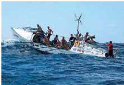
«Мондиаль-2» в открытом океане