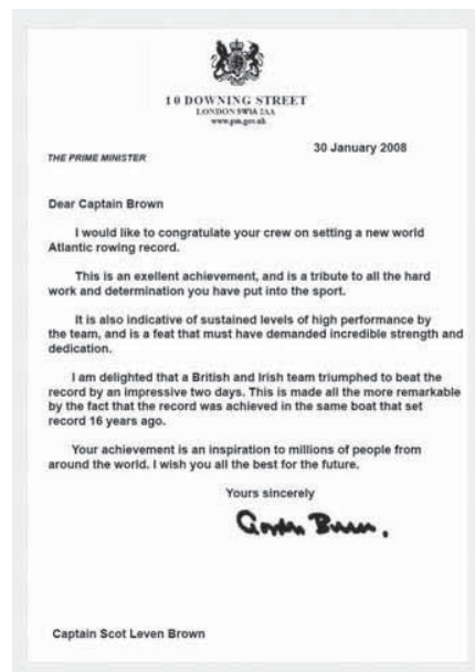
Приветствия экипажу «Мондиаль-2» от премьер-министра Великобритании