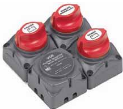
Коммутирующие переключатели аккумуляторов легко собираются в блоки по числу батарей

количество электрических приборов и арматуры. Все они отвечают требованиям безопасности американской ассоциации АВУС. В их числе – главные распределительные щиты, автоматические предохранители, блоки сопряжения нескольких аккумуляторных батарей, модули подключения к внешнему источнику и т.п. В отличие от изделий многих малоизвестных производителей коммутирующая арматура «BER Marine» маркируется на основе тестовых испытаний по процедуре UL 1107 на перегрев воздействием стартовых (10 с), кратковременных (5 мин.) и продолжительных (1 час) предельных токов. Большинство приборов имеет модульную конструкцию и легко объединяется в функциональные комплексы. Ассортимент, ввозимый «Техномарином», включает те приборы, аналоги которых трудно найти у нас, в первую очередь это относится к «интеллектуальным» микропроцессорным системам.