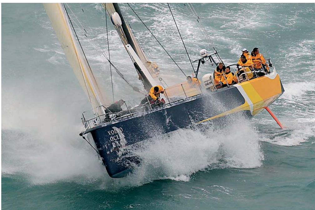
Российская яхта «Косатка» финиширует в Кейптауне на первом этапе гонки «Volvo Ocean Race» (стр. 130).