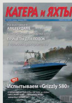
На обложке: мотолодка «Grizzly 580» на редакционной «мерной миле» (стр. 30).

Подписка через редакцию — с любого номера!