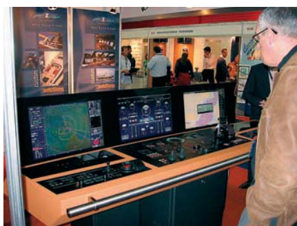
Приборы на панели управления судном стали «виртуальными» – отображаются на плоских экранах

ленными европейскими и азиатскими компаниями, сплошь идут в экономичном светодиодном исполнении; лампы накаливания, похоже, ушли в прошлое. Микроэлектроника проникла во все элементы судовых систем. Разнообразные мониторы следят за уровнем воды и топлива в цистернах, отслеживают работу помп и кондиционеров, управление механизмами перешло на сервоприводы, а приборные панели стали виртуальными – в виде дисплейных экранов. По спецзаказу вам сконфигурируют электронный пост управления любой сложности – хватило бы надежности генераторов. Управляемые интерцепторы на мировом рынке предлагает не одна только «Volvo Penta». У шведской компании «Humphree» из Ге-