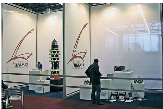
Стенд с экспонатами-лауреатами номинации «DAME» за лучшее конструктивное решение – один из немногих элементов шоу на «METS»

Характерной приметой года стало широкое распространение гибридных дизель-электрических силовых установок. Достаточно было в отмеченную награду продукцию попасть агрегату от «Steurg», как в перспективную область устремились и другие производители, например «Beta Marine», пошедшие еще дальше: мощность их электромотора не 7, а 10 кВт, стоимость же комплекса ниже, чем у награжденного конкурента.