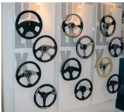
«Ultraflex» готова подсократить производство, но не жертвуя ассортиментом