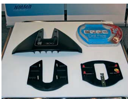
Такие гидрокрылья с поджимной пластиной не требуют сверления антикавитационной плиты

теборга их целый модельный ряд, охватывающий ширину от 750 до 3000 мм, и полный комплект систем управления для них, стабилизирующих посадку судна – ручного и автоматического. Но если интерцепторы нам в России «не указ», то ветровые и каютные стекла «Taylor Made» благодаря дилеру уже хорошо известны с 2006 г. Срок поставки составляет шесть–восемь недель, и цена зависит не столько от сложности заказа, сколько от его серийности. Винтостроители в лице тайванцев из фирмы «Solus» (о них – отдельный разговор) и американцев из «Turning Point», дружно направившие усилия на разработку сменных резинопластиковых втулок, совместимых с системой «Flo-Torq», также хорошо представлены в России... Но остановимся на перечислении знакомых и незнакомых фирм из-за ограниченности отведенного для публикации объема. Перейдем к выводам.