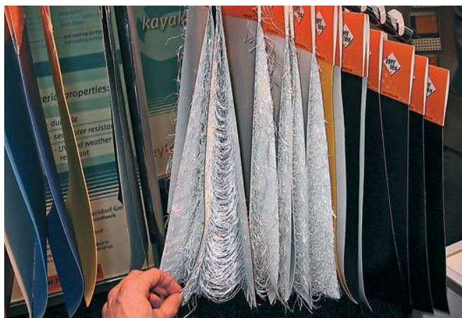
Ткани «Airdeck» производства германской компании «Heytex»