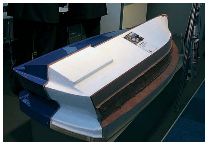
Всем известные герметики «Sika» теперь используются и в модельном производстве

полагается, стремились продемонстрировать все свои возможности, и, видимо, для того чтобы легче работалось прессе, организаторы учредили особую ежегодную награду «DAME» («Design Award METS») за товары, лучшие по замыслу и воплощению. Самые-самые из них выставляются на специальном стенде – пожалуй, это был единственный из элементов здешнего шоу. В этом году награды за лучший дизайн