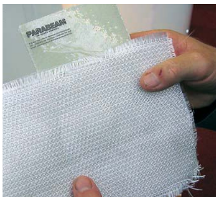
Ткань «Parabeam» при пропитке смолой сама образует трехмерную сотовую структуру