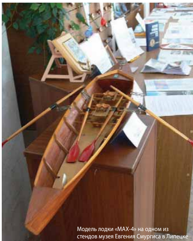
Модель лодки «МАХ-4» на одном из стендов музея Евгения Смургиса в Липецке