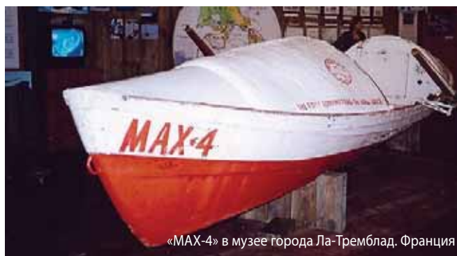
«МАХ-4» в музее города Ла-Тремблад, Франция