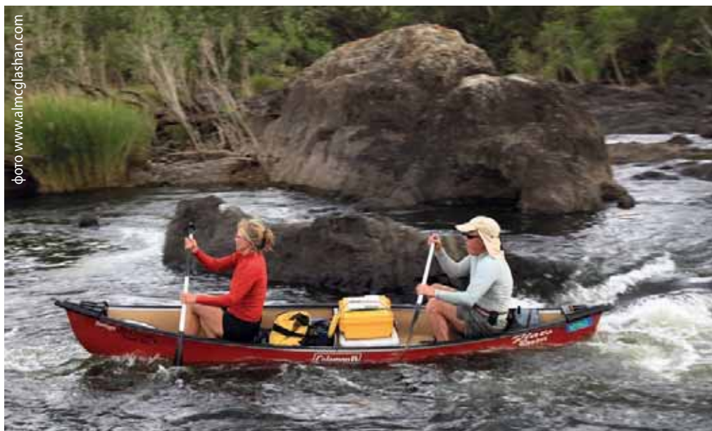
Правый приток реки Кларенс – Манн вскоре проявит свой непростой характер

первым делом орешь что есть мочи: «Весло-о-о-о!».