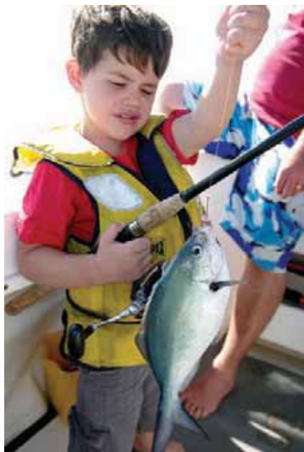
В Австралии рыбалке обучают с пеленок

Если у нас в стране большинство разумного человечества, странствующего по подобным речкам, использует байдарки, то у «проклятых капиталистов» для этих целей существует каное с однолопастным веслом, доставшийся нам от индейцев. Впрочем, в США уже есть транцевые модели таких посудин, на которые можно без боязни прице-