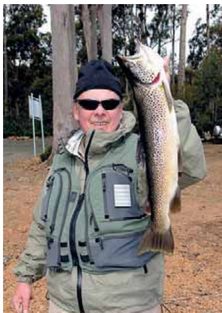
Тасмания – настоящий рай для форелиста