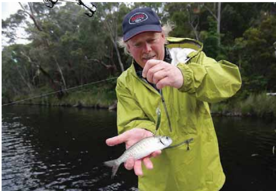
Местным селедкам понравились воблеры из России