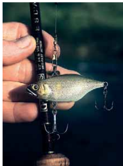
Вкусная приманка раттлин