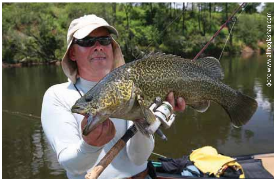
Знаменитая австралийская «треска»

кам типа этого Манна весьма сложно. Во-первых, погода может пять раз на дню поменять настроение, сменив проливной холодный дождь на сорокаградусный солнцепек, а во-вторых, на каждый километр реки предстояло пройти как минимум пять камени-