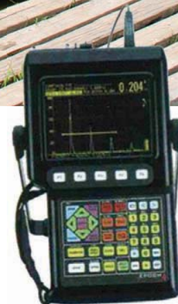
Рис. 1. Портативный дефектоскоп «ДАМИ-С» с акустическим сканером «РС-1» и преобразователем свободных колебаний «ИПУ-1»

Полувековой опыт пластикового судостроения не дал однозначного ответа на вопрос, как отформовать корпус, чтобы не иметь с ним проблем на протяжении всего срока эксплуатации. Нам не хватает осознанного опыта владения корпусами, изготовленными с теми или иными технологическими особенностями, понимания их пригодности в конкретных условиях эксплуатации, что послужило бы основой для принятия решения при покупке нового либо бывшего в эксплуатации судна. Предлагаемое рассуждение на тему качества стеклопластиковых корпусов наверняка даст полезную информацию для этого.