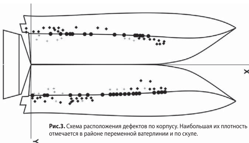
Рис.3. Схема расположения дефектов по корпусу. Наибольшая их плотность отмечается в районе переменной ватерлинии и по скуле.

грузкой проходят медленнее. Более текучие и хрупкие смолы лучше пропитывают волокна, но и рост дефектов в таком ламинате происходит существенно быстрее и скачкообразно, со значительными по площади расслоениями.