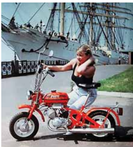
Мини-мокик «Рига-26» советских времен еще доступен на вторичном рынке

Как уже отмечалось, современные велосипеды могут на порядок отличаться по цене. Цена говорит о качестве и надежности (ни для кого не секрет, что дешевый китайский велосипед способен «посыпаться» уже на пер-