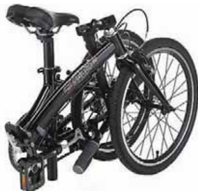
В сложенном виде складной велосипед довольно компактен и даже помещается в рюкзак или специальный кейс

В принципе, взять на борт компактной мотолодки вроде той же сакраментальной «Казанки» можно и обычный шоссейный, «городской» или «горный» велосипед. Чтобы разместить его покомпактней (например, засунуть в подходящих размеров багажник), можно снять переднее колесо, что на большинстве образцов не представляет особого труда. Если вы остановили свой выбор на «пол-