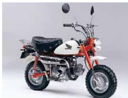
Мини-мопик «Honda Monkey» породил множество китайских клонов

Но вообще-то при выборе такого двухколесника советуем ориентироваться на его цену — самые дешевые модели (обычно китайские либо китайско-российские) стоят порядка 3–4 тыс. руб., а подержанную «Каму» можно найти и вовсе за 500 руб. На сверхкомпактные модели с крошечными колесиками-роликами советуем останавливать свой выбор только в