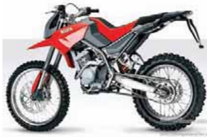
Кроме мокиков, скутеров и мотосамокатов-гопедов фирма «Blata» выпускает действующие миниатюрные копии «взрослых» мотоциклов

Но предположим, что вы не относитесь к числу любителей крутить педали и более привыкли полагаться на двига-