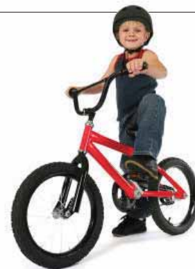
Спортивный BMX компактен и наделен «кроссовыми» качествами, но имеет ряд ненужных для чисто транспортного использования функций

норазмерной» машине, то «горный» велосипед с толстыми «зубастыми» шинами и множеством передач предпочтительнее — далее не всегда мы швартуемся в цивилизованном месте, где асфальт начинается у самой воды, так что важна способность велосипеда управляться с грунтом — например, с узкими кочковатыми лесными тропинками. Кроме того, близость воды обычно означает значительные перепады рельефа, преодолевать которые удобнее при возможности увеличить передаточное отношение цепного привода, т.е. велосипед должен иметь несколько передач.