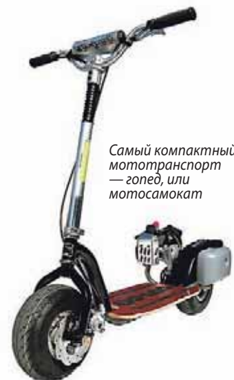
Самый компактный мототранспорт — гопед, или мотосамокат

ками рабочим объемом 25–45 см 3 . Типичный пример такого транспортного средства — «Blatino Small Kit» упомянутой уже фирмы «Blata». Еще их называют мотосамокатами, поскольку на некоторых моделях нет даже сиденья, и ездок располагается стоя (за рубежом также используется термин «гопед»). Даже самые компактные модели гопедов нередко имеют клиноремненные вариаторы, позволяющие преодолевать значительные подъемы. Из-за небольшого диаметра колес такое транспортное средство лучше всего чувствует себя на асфальте. Надо сказать, что маленькие размеры отнюдь не означают и столь же маленькую цену. Стоить гопед может не меньше «взрослого»