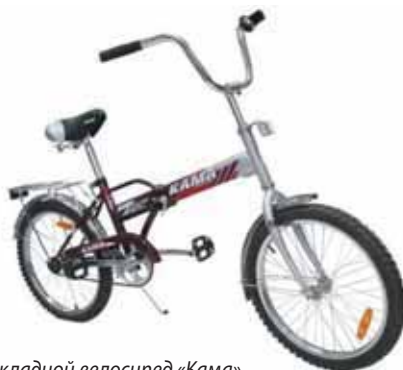
Складной велосипед «Кама» выполнен по классической схеме с хребтовой рамой

Велосипеды относятся к тем разновидностям товаров, выбор которых сейчас как нельзя велик. Речь идет не об одном только многообразии марок,