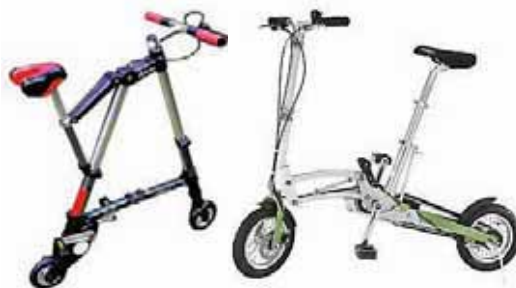
Модели с маленькими колесиками хороши в основном на асфальте