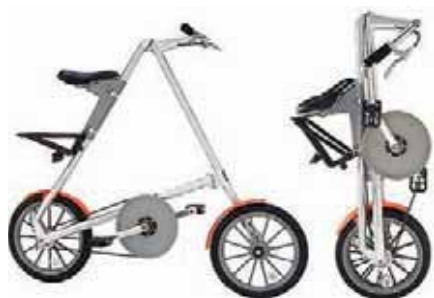
Главный недостаток «продвинутого» складного велосипеда «Strida» — высокая цена