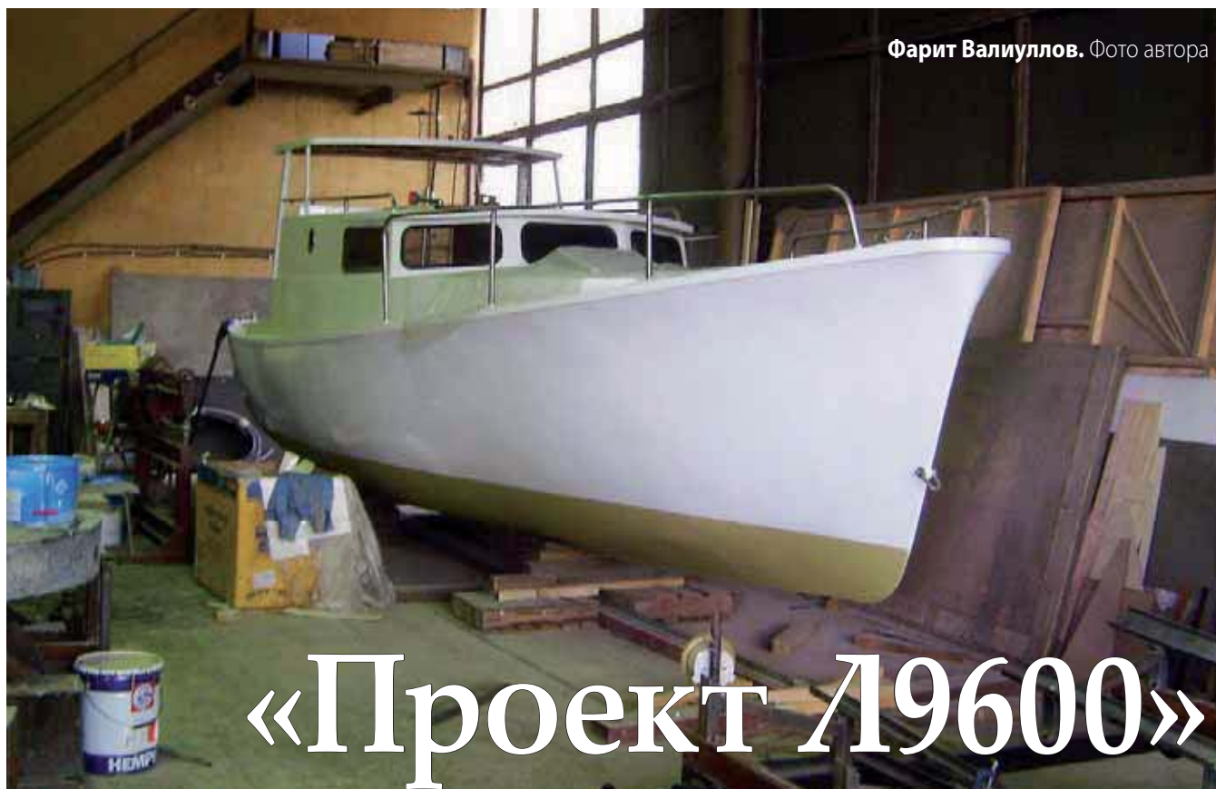
Фарит Валиуллов.