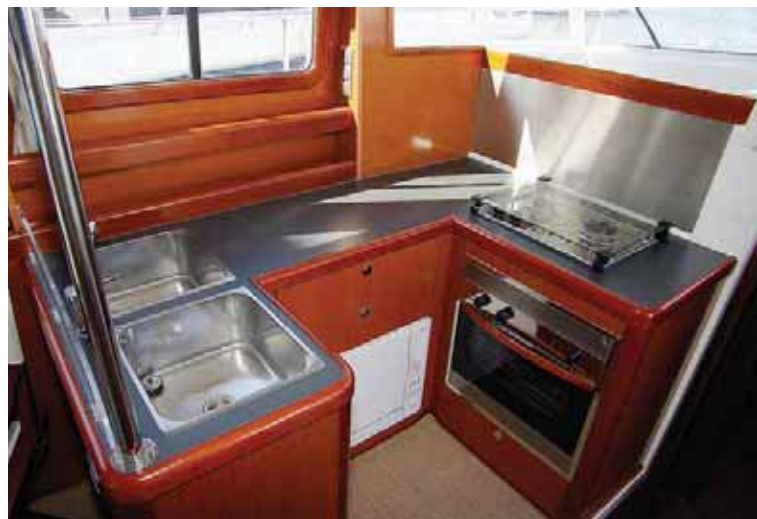
С-образный камбуз: удобен для работы даже на качке