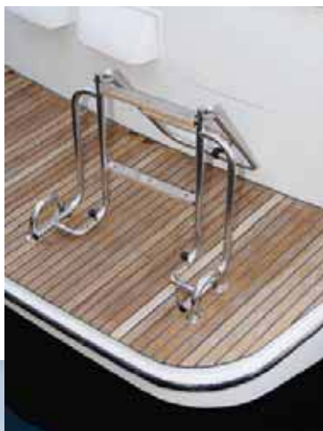
Купальная платформа: раскладной трапик