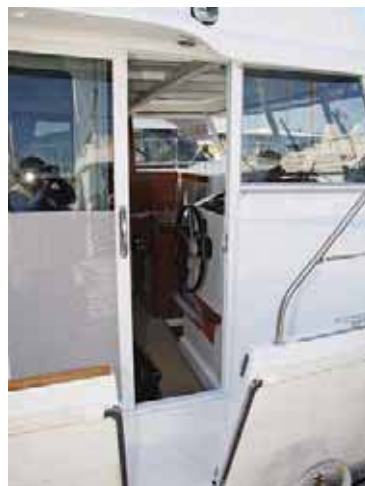
Водительское место: сдвигающая бортовая дверь