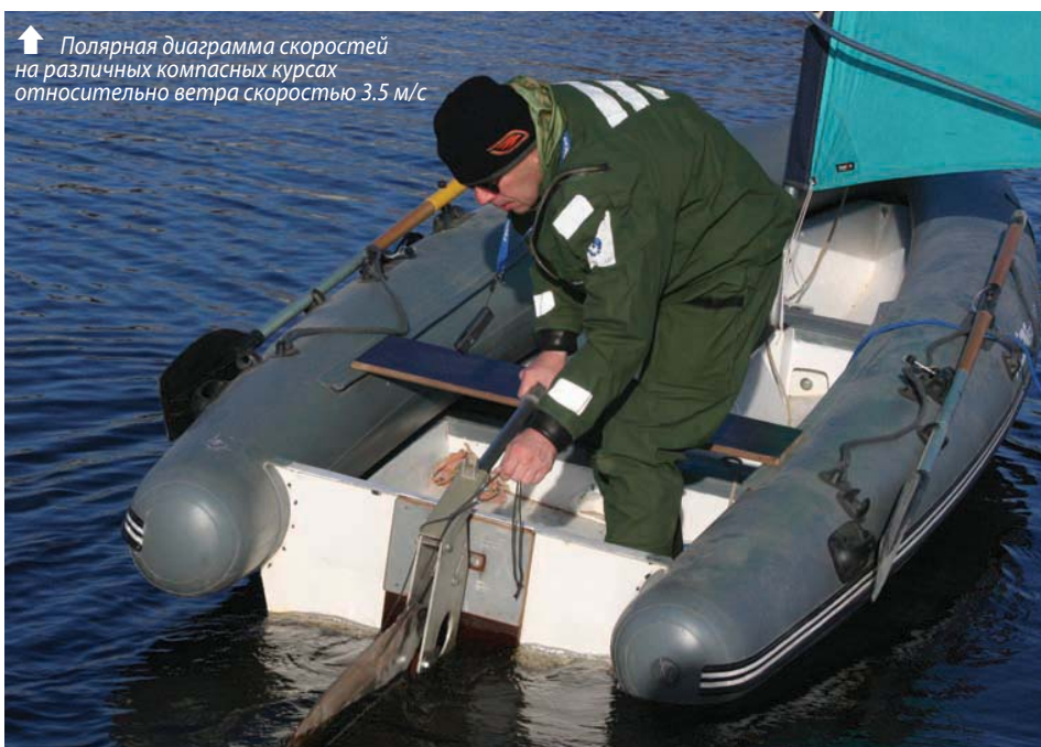
↑ Полярная диаграмма скорости на различных компасных курсах относительно ветра скоростью 3.5 м/с

уишбон, как на виндсерфере. Парус набили «в доску» за счет лишь мышечных усилий, без всяких талей, хотя и этого хватило, чтобы мачта приобрела небольшой прогиб. Вставили единственную лату, расположенную в верхней трети паруса.