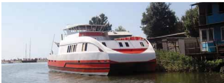
« Борей », экспедиционный катамаран, длина – 19,5 м, ширина – 8,75 м, масса – 60 т, двигатели – 2×400 л.с.