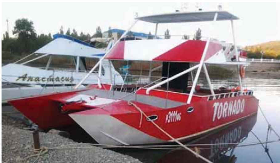
« Торнадо », прогулочный катамаран, длина – 13,5 м, ширина – 6 м, масса – 7 т, двигатели – 2×250 л.с.