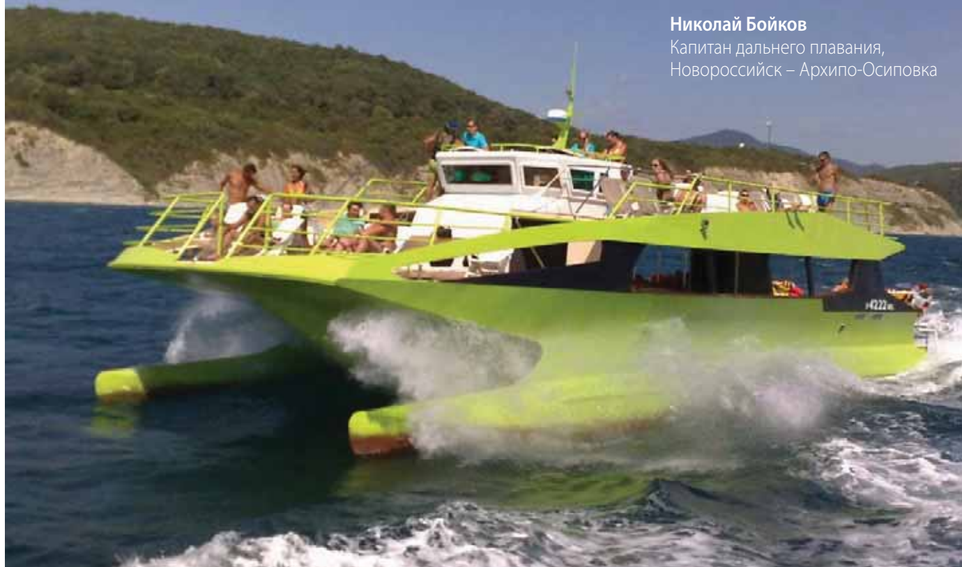
«Барракуда», прогулочный катамаран, длина – 19 м, ширина – 6,6 м, масса – 12 т., двигатели – 2×70 л.с.

Капитан дальнего плавания, Новороссийск – Архипо-Осиповка