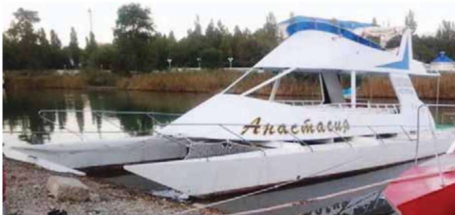
« Анастасия », прогулочный катамаран, длина – 17,5 м, ширина – 6 м, масса – 7 т, двигатели – 2×90 л.с.

А холмистый берег лиманов свободен под плановые застройки базовой инфраструктурой. Можно яхтенный «рукомойник» устроить – от Анапы на Тамань, на Темрюк, на Ейск, по лиманам, по протокам и заводям, по каналам «кубанской Голландии»! А какие яхтенные марины можно построить в устьях рек по Архипо-Осиповке и по Туапсе! Одно только надо учесть – что реки эти начинаются в горах, потому очень способны мгновенно набирать полноводный поток, стремительный гонор; горы плавника – это вам не лиманы Кубани – снесет яхты в Черное море или утопит у причалов, если не защитить стоянки обводными брекватерами. Но это легче, чем пытаться обеспечивать безопасность маломерных судов на переходе Анапа – Сочи службой судовспасателей, совершенно беспомощных при южных ветрах и волнении. А волнение в районе Туапсе – Сочи особенно: тяжелая и крутая волна не позволяет войти в порт, рвет якорь-цепи, заставляет уходить от берега, и рассчитывать можно только на опыт судоводителя, надежность судна, запасы судового топлива – весьма ограниченные ресурсы для малого судна.