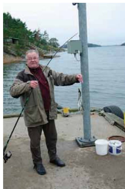
Салака клевала в заливе на голый крючок

крупной морской щуке в голове у любого россиянина всплывало лишь одно название – Аландские острова.