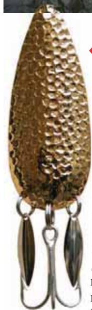
← Классика от Eppinger – золотистая Dardevlet

бизнесу следует помогать. В первую голову рекреационному – основе основ здоровья любой нации.