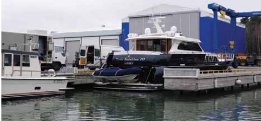
Марина Nautical готовит очередной катер для зимнего хранения