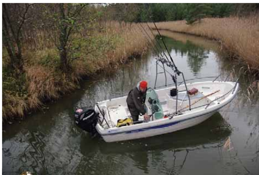
В узких лабиринтах среди россыпи островов