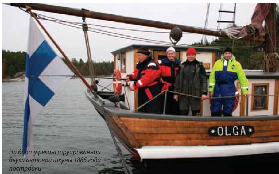
На борту реконструированной двухмачтовой шхуны 1885 года постройки