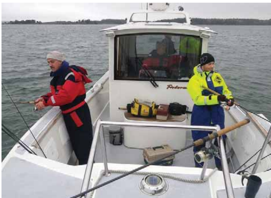
Профессиональные рыболовные катера верфи Satavan