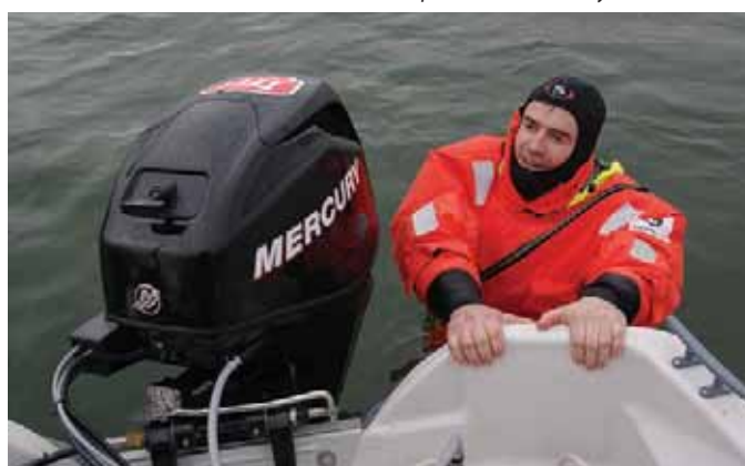
Поздней осенью следует очень тщательно выбирать экспедиционную одежду

Но и без хитромордых кумж рыбалка получилась знатная – ежедневно мы воевали как минимум с одним солидным оппонентом. Хотя было много сходов и занимательных эпизодов, когда хищница вдруг вылетала за блесной из пучин и вдруг останавливалась в метре от борта. Щука брала в основном на дорожку метрах в 5–10 от травы, на глубинах 3–5 метров. Имея некрупный катер, нам удавалось пролезть почти во все внутренние лазейки, которые внезапно превращались в тайные заливы, где кроме белоснежных лебедей и упитанных уток не было видно ни единой души.