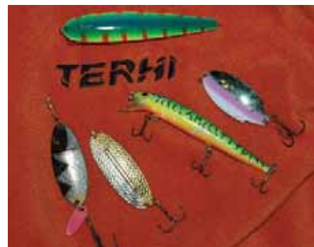
Осенний соблазн морской щуки