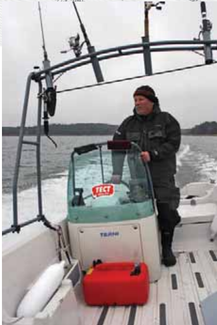
Полосы нескользящего материала – эффективное решение, характерное для Terhi

Вдобавок к морским «забегам» мы планировали еще проинспектировать узкие мелководные проходы в при-