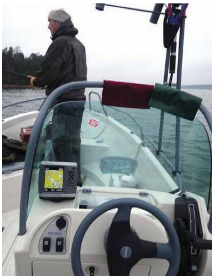
Без GPS в Архипелаговом море делать нечего

Естественно его ящик и был до краев забит этой яркой мишурой.