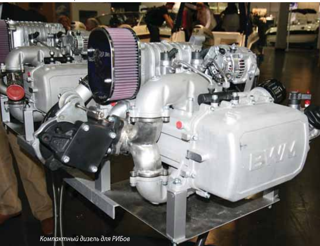
Компактный дизель для РИБов