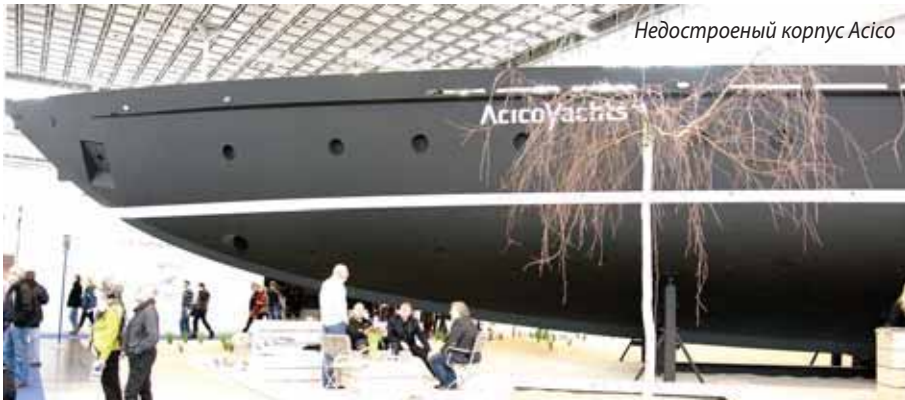
Недостроенный корпус Acico

Они были специально задуманы и разработаны для РИБов и благодаря компактности могут быть легко установлены в любом кокпите.