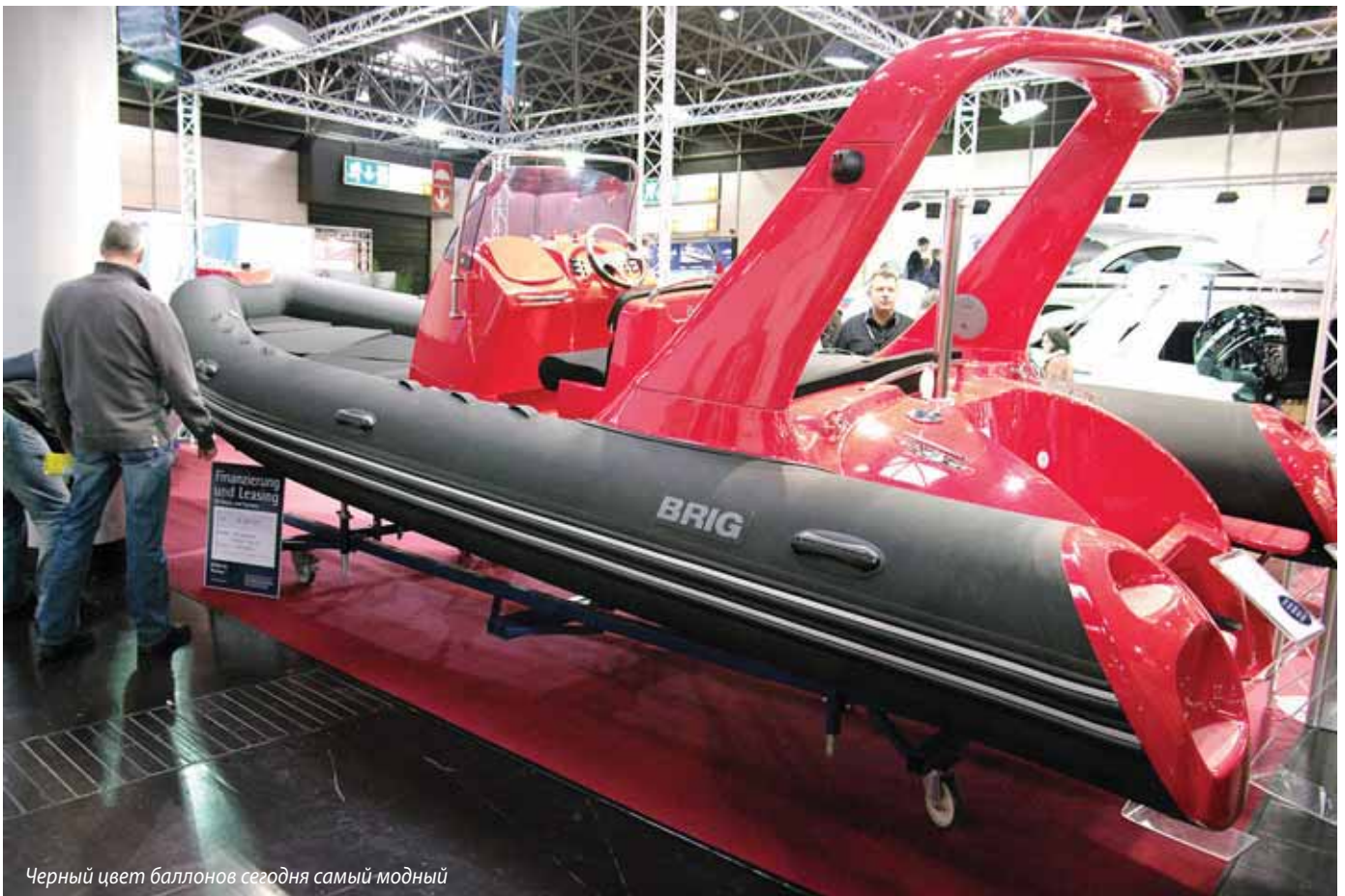
Черный цвет баллонов сегодня самый модный

РИБов и надувнушек в Дюссельдорфе было больше, чем я ожидал. Среди баллонов почему-то преобладали черные цвета (самое, пожалуй, лучшее сочетание было у украинского Brig – жгуче черный борт и ярко красный кокпит). Хайполон и ПВХ на выставочных стендах рас-