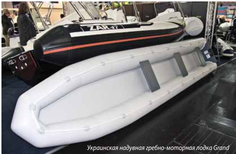
Украинская надувная гребно-моторная лодка Grand