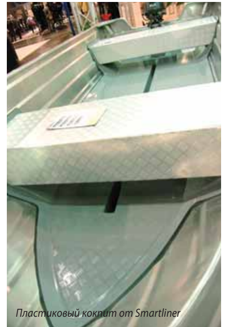
Пластиковый кокпит от Smartliner