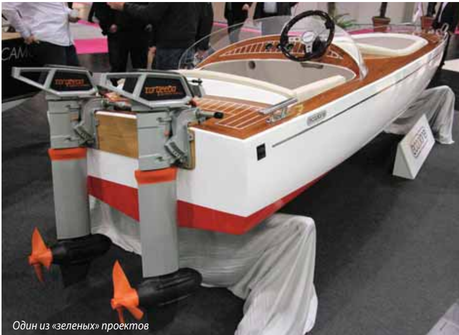
Один из «зеленых» проектов