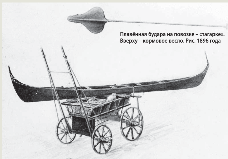
Плавённая будара на повозке – «тагарке». Вверху – кормовое весло. Рис. 1896 года

В начале XX века плавные будары имели такие основные характеристики: длина 7.1–9.25 м, ширина 0.7–0.8 м, высота борта 0.44–0.53 м, вес 82–164 кг, осадка порожнем 4.4–13.2 см, грузоподъемность 410–655 кг. После завершения постройки, чтобы лодка не гнила и не растрескивалась, ее высмаливали изнутри и снаружи. Окрашивались будары в разные цвета по желанию хозяев (синие, голубые, зеленые, даже полосатые), а лодки пла-