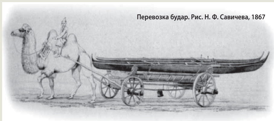
Перевозка будар. Рис. Н. Ф. Савичева, 1867