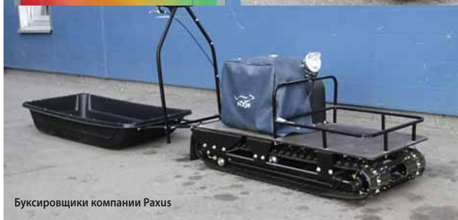
Буксировщики компании Рахус