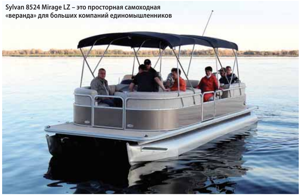
Sylvan 8524 Mirage LZ – это просторная самоходная «веранда» для больших компаний единомышленников

Оба тестируемых – типичные американцы, со всеми сопутствующими конструктивными и эргономическими особенностями. Ширина обоих допускает свободную транспортировку по дорогам, но больший, Mirage с его 2.59 м – только по амери-