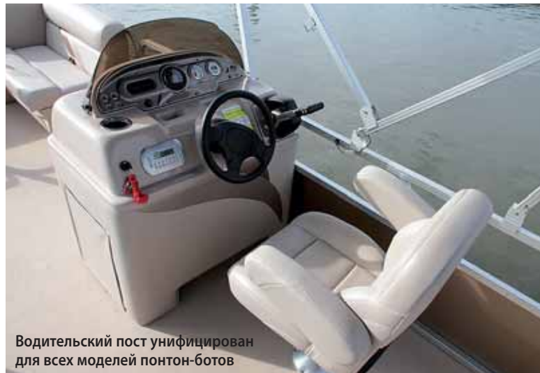
Водительский пост унифицирован для всех моделей понтон-ботов