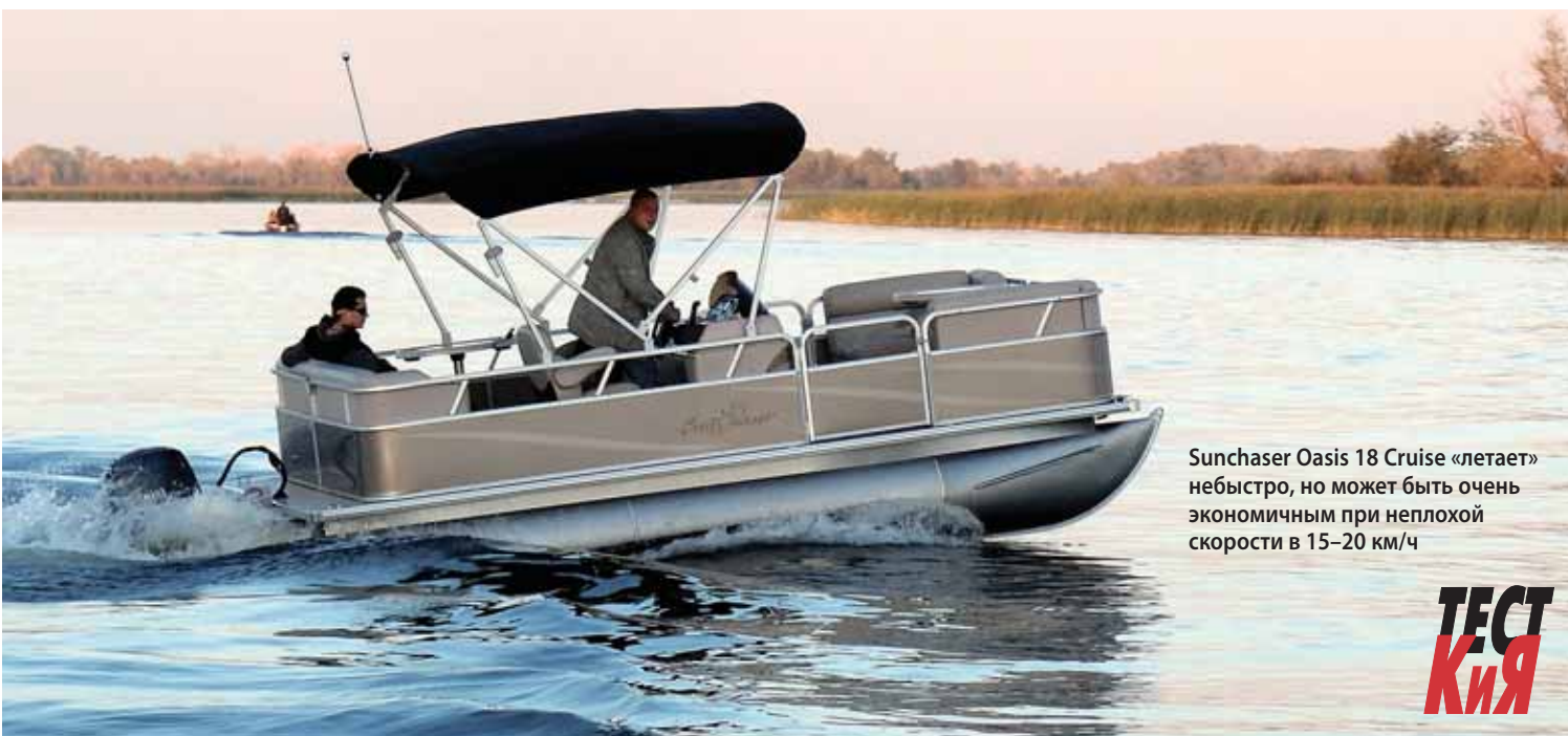
Sunchaser Oasis 18 Cruise «летает» небыстро, но может быть очень экономичным при неплохой скорости в 15–20 км/ч