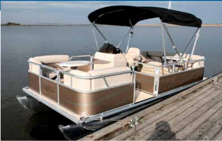
Возможен вариант «облегченного», солнцезащитного тентования

вроде невыраженного «горба», с преодолением которого судно заметно всплывает, слегка дифференцируется на корму и глиссирует с отрывом потока от округлых бортов поплавков при скорости около 30 км/ч. Шум достигает типичных для открытых лодок значений 80–85 дБ, причем отчетливо слышен звон воды, бьющей в алюминиевые конструкции – довольно громко, но слушать его целый день придется едва ли.