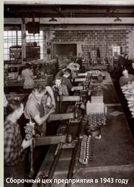
Сборочный цех предприятия в 1943 году

Расположенная в городе Фонд-дю-Лак, штат Висконсин, компания Mercury Marine является крупнейшим в мире производителем рекреационных морских двигателей. Подразделение Mercury компании Brunswick