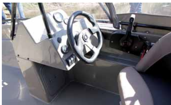
Компоновочные решения «490-й» типичны и хорошо отработаны: две консоли, «калитка» в проходе, тент. Есть место и приятным нюансам вроде затемненных краев стекол или «сплюсненной» снизу баранки руля

Н о когда рынок наполнен достаточным количеством похожего товара с близкими ценами, наиболее развитые производства в состоянии выдать продукт, качество и цена которого перестанут быть предметом выбора. Они установятся на устраивающем большинство среднестатистическом уровне, и покупателю останется выбрать товар лишь по специфическим, нужным именно ему признакам.