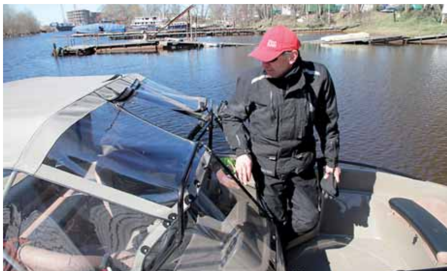
Носовой кокпит – практичное решение, когда на борту двое рыбаков. Проход в него приходится закрывать в три приема