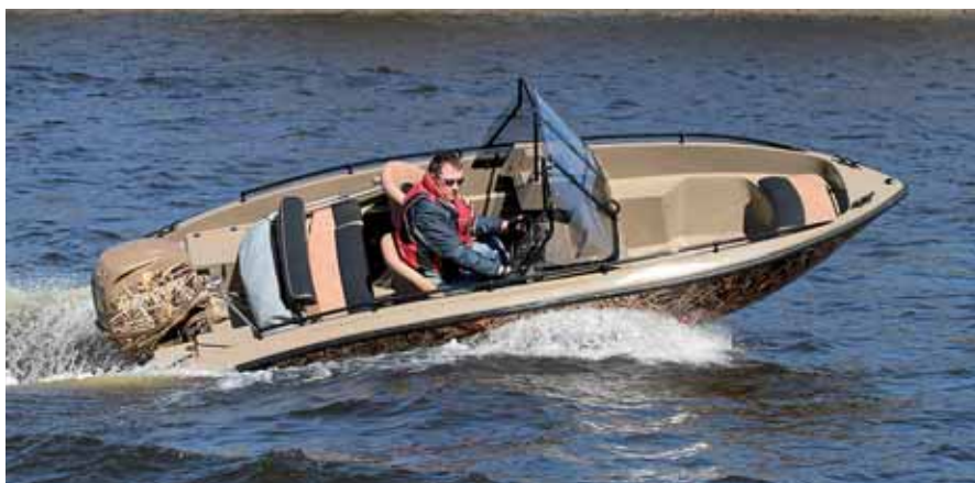
Борт лодки относительно невысок, в повороте водитель видит воду совсем рядом с собой

«Полусредний» размер лодки требует осмысления. С одной стороны, это уже не клон «дюралек» 4.2–4.5 м –