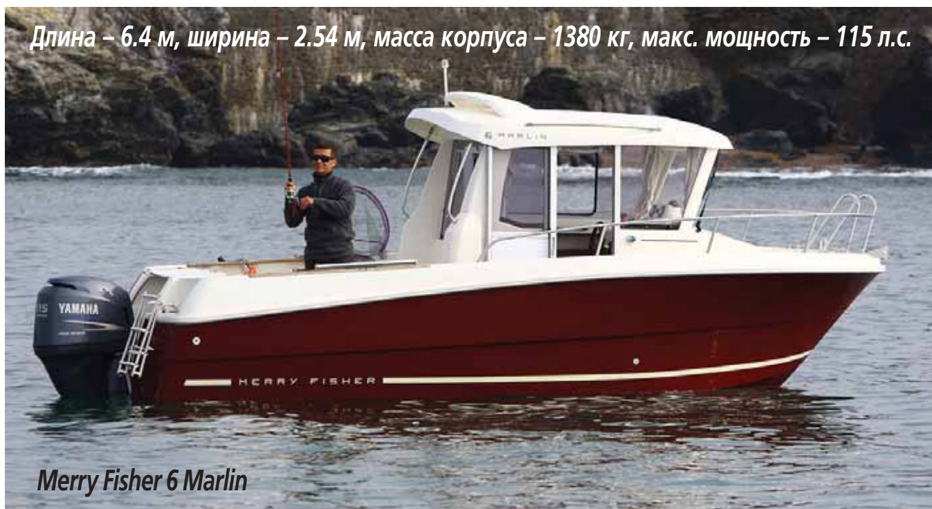
Merry Fisher 6 Marlin

Длина – 6.4 м, ширина – 2.54 м, масса корпуса – 1380 кг, макс. мощность – 115 л.с.