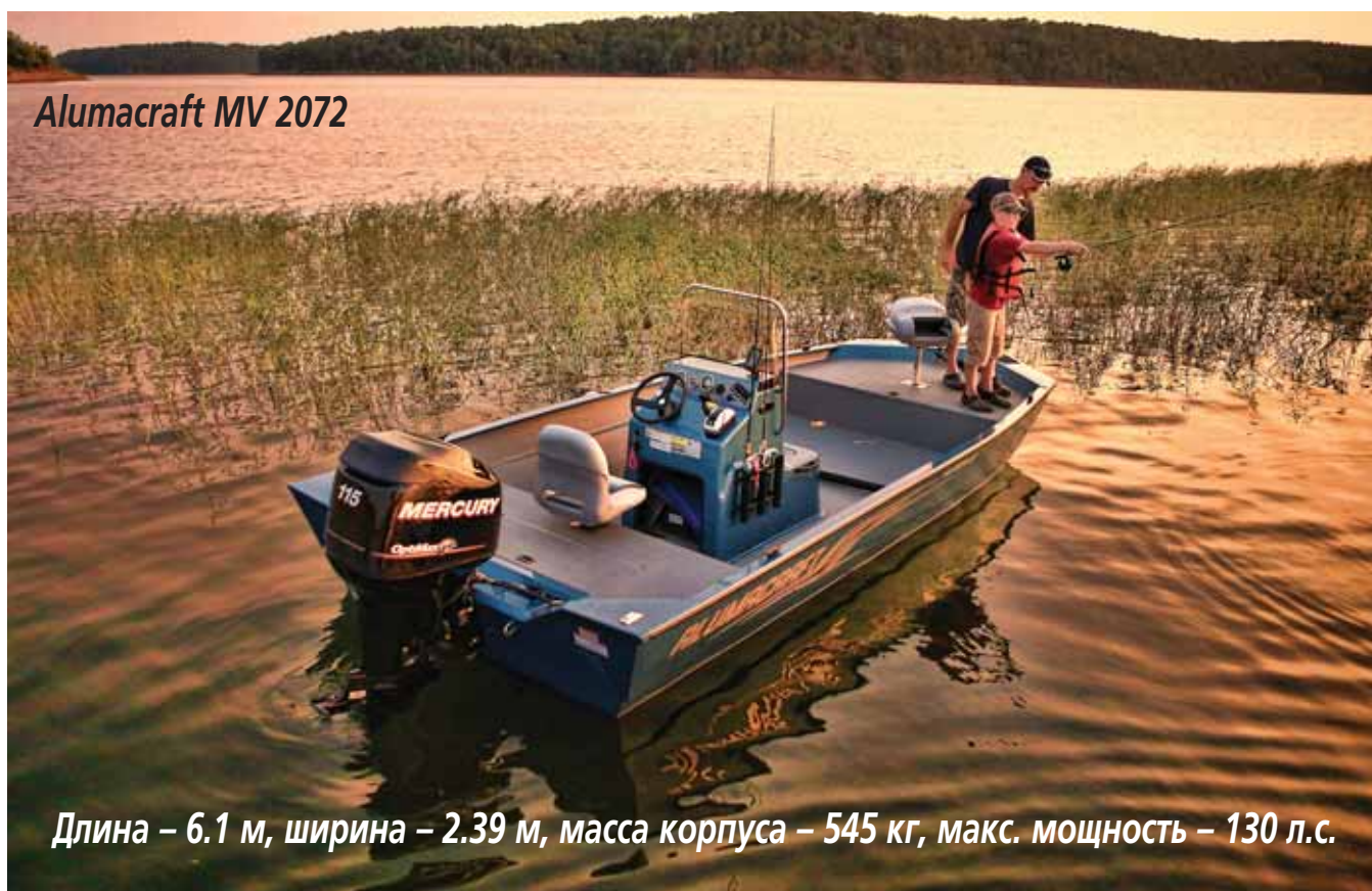
Alumacraft MV 2072

Длина – 6.1 м, ширина – 2.39 м, масса корпуса – 545 кг, макс. мощность – 130 л.с.