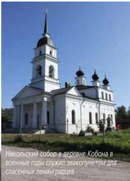
Никольский собор в деревне Кобона в военные годы служил эвакуунктом для спасенных ленинградцев