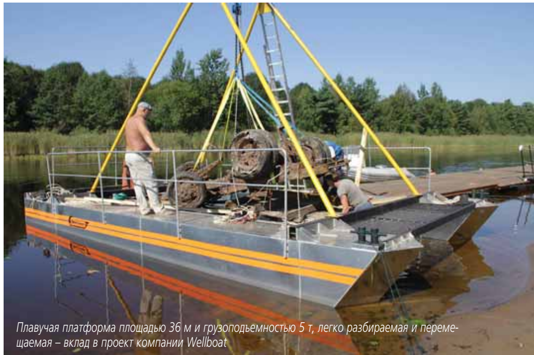
Плавучая платформа площадью 36 м и грузоподъемностью 5 т, легко разбираемая и перемещаемая – вклад в проект компании Wellboat