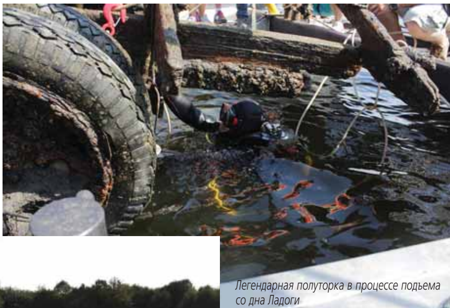
Легендарная полуторка в процессе подъема со дна Ладоги

исполняющий роль эвакуанта. С января 1942 года Кобона была соединена железной дорогой со станцией Войбокало и далее со всей страной, а с Ленинградом связь проходила по Ладоге до порта Осиновец возле станции Ладожское озеро. В навигацию между югом и западом Ладоги курсировали баржи и частично военные корабли, а с установлением ледостава в ход шли автомобили, в том числе легендарные ГАЗ-АА, известные под именем полуторка.