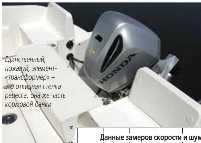
Единственный, пожалуй, элемент-«трансформер» – это откидная стенка рецесса, она же часть кормовой банки

Проход волны исследовать в рамках экспресс-теста не получилось, но можете быть уверены – при килеватости днища около 20° и таком без преувеличения красивом развале высокого борта в носу этому судну покорится любая волна вплоть до мак-