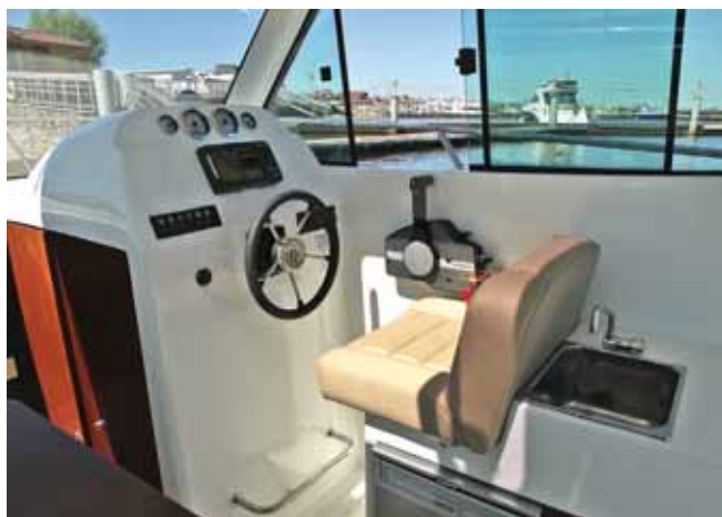
Оборудование салона расположено вольготно, без стремления к компромиссу с занимаемым им пространством

можно снять ради полного освобождения пространства. Кокпит закрывается от солнца оригинальным тентом на выдвигающих дугах.