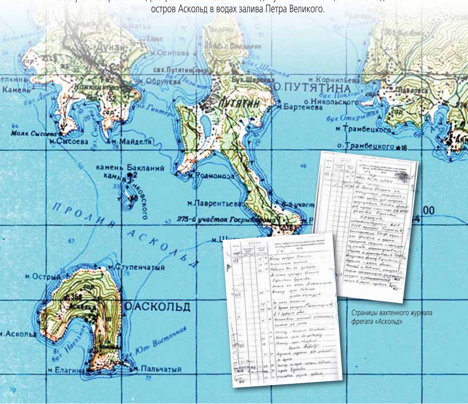
Страницы вахтенного журнала фрегата «Аскольд»

Сегодня, когда вектор мышления стремительно меняется в сторону осмысления и возвращения утраченных национальных ценностей, настала пора рассказать о некоторых российских островах – незаслуженно брошенных, разграбленных и забытых в годину лихолетья конца XX века. Один из них – остров Аскольд в водах залива Петра Великого.