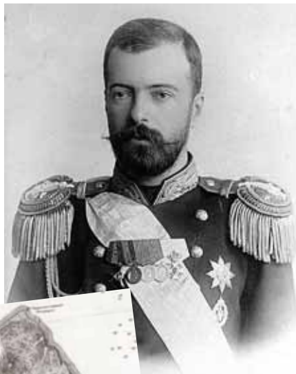
Великий князь Александр Михайлович

Но когда Молчанский и представители местных властей прибыли на остров для отвода земельного участка под прииск, оказалось, что там вновь хозяйничают манзы. Заведующий Сейфунским округом 18 декабря 1873 года докладывал генерал-губернатору Приморской области: «<...> на острове вновь началась хищническая разра-