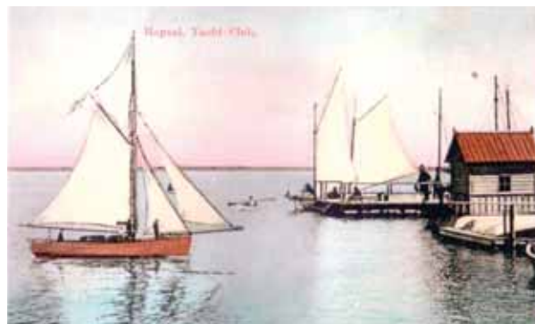
Хаапсалу. Яхт-клуб. Открытка начала XX в.