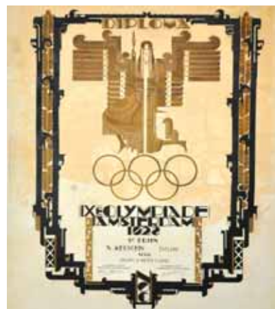
Команда Эстонии на Олимпиаде 1928 г. Диплом за третье место