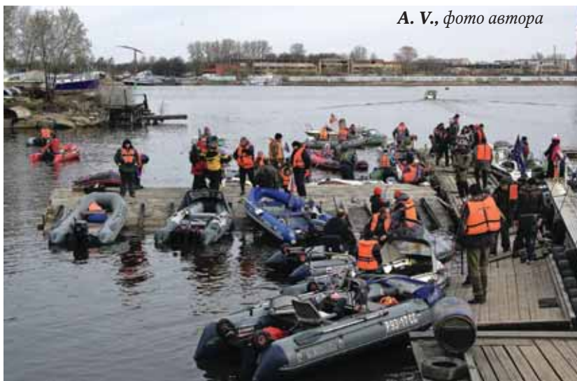
А. В., фото автора