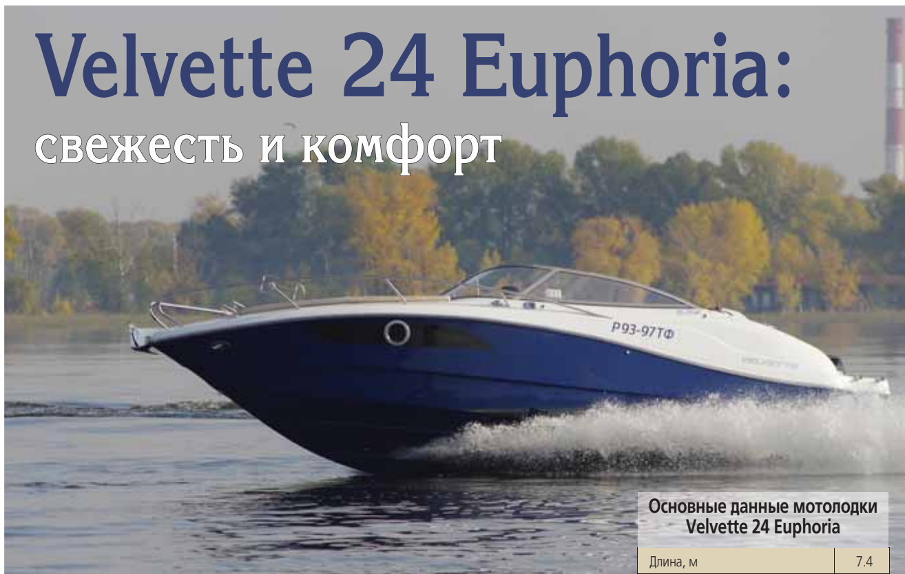
Основные данные моторной лодки Velvette 24 Euphoria