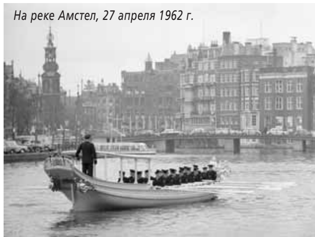
На реке Амстел, 27 апреля 1962 г.

современным мерам безопасности на воде и предстоящего процесса реставрации.