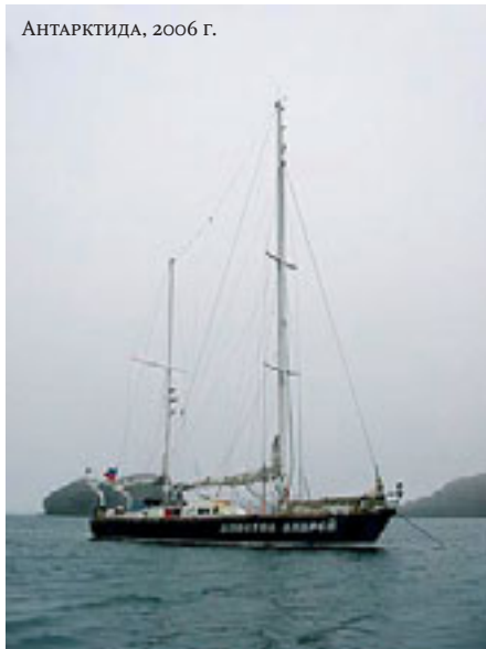
АНТАРКТИДА, 2006 г.

Зато хорошо помню, какими были мы. А были мы тогда “сухими”, абсолютно: последние капли топлива слили из танка и из печки, нашли еще бутылку