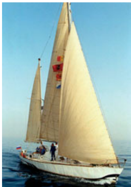
Фото 1997 г.: “Апостол Андрей” на подходе к Кейптауну и его экипаж

Ваш Литая, 28.03.2006 г., борт яхты “Апостол Андрей”, Кейптаун