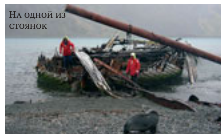
На одной из стоянок

ледный чайник. Он же прослыл главным врагом экипажа, когда делил оставшиеся галеты, и мне приходилось грудью и авторитетом капитана прикрывать ни в чем неповинного кока.