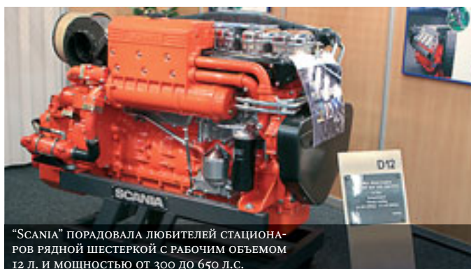
“SCANIA” ПОРАДОВАЛА ЛЮБИТЕЛЕЙ СТАЦИОНАРОВ РЯДНОЙ ШЕСТЕРКОЙ С РАБОЧИМ ОБЪЕМОМ 12 л. и мощностью от 300 до 650 л.с.

вило 4320 ед., или 15.8% общего количества продаж в Финляндии. Общие продажи двухтактных моторов составили 65%. Наиболее продаваемые (около 40%) моторы — мощностью 5 л.с и меньше.