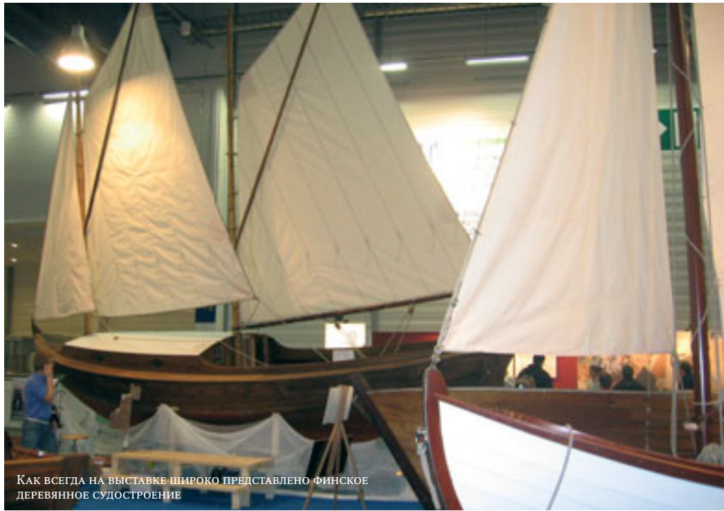
Как всегда на выставке широко представлено финское деревянное судостроение

— на манер сигарет у нас. Но, видимо, она оправдывает себя. После осмотра шести залов Центра становятся очевидны рыночные тенденции — они в основном те же, что и в Дюссельдорфе. Первый, самый крупный моторно-катерный зал добавил выставке престижности: все его пространство заняли производители и дилеры, сделавшие упор на крупногабаритную продукцию и полные типоразмерные ряды; “мелочевка” же перекочевала в другие залы, причем в ее ряды угодил даже такой патриарх финской лодочной индустрии, как “Terhi”. Основные международные премьеры уже были нам знакомы, поэтому интересно было пообщаться на стендах с представителями популярных финских брендов, а также с заезжими “абитуриентами”, выяснить их намерения и видение рыночного успеха.