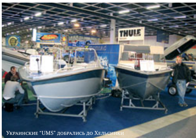
Украинские "UMS" добрались до Хельсинки

нас "Faster". Основой его технической политики остается принцип строить лодки в первую очередь для работы, тем не менее новая модель "Faster-525" выглядит существенно современнее своих сестер с ее новой пластиковой консолью, дизайн которой прорабатывала специализированная фирма из Котки.