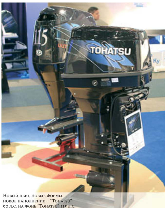
Новый цвет, новые формы, новое наполнение – "HONDA" 90 л.с. на фоне "HONDA" 115 л.с.

кожи и представить себя, к примеру, на Багамах в окружении туземных красавиц. Те, кто находятся между этими двумя крайними проявлениями тяги к морю, без остановки снуют между выставленными моторами и изучают, изучают то, что, скорее всего, им не пригодится.