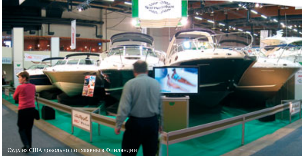
Суда из США довольно популярны в Финляндии