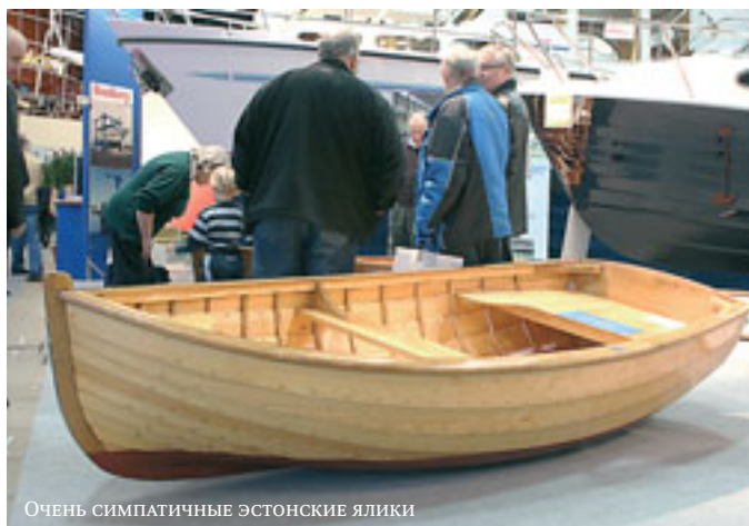
Очень симпатичные эстонские ялики