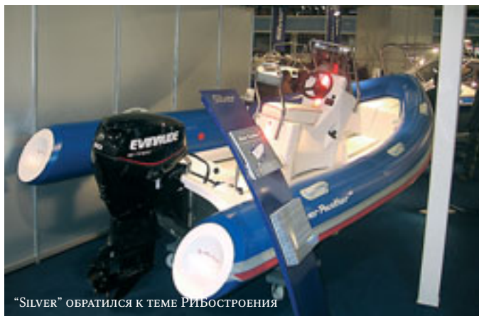
"SILVER" ОБРАТИЛСЯ К ТЕМЕ РИБОСТРОЕНИЯ