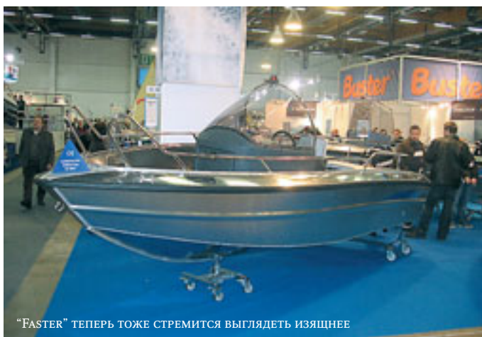
"FASTER" ТЕПЕРЬ ТОЖЕ СТРЕМИТСЯ ВЫГЛЯДЕТЬ ИЗЯЩНЕЕ