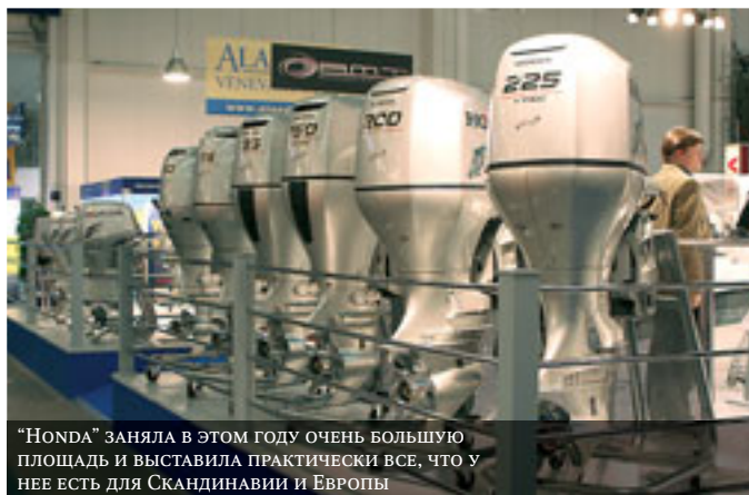
“HONDA” ЗАНЯЛА В ЭТОМ ГОДУ ОЧЕНЬ БОЛЬШУЮ ПЛОЩАДЬ И ВЫСТАВИЛА ПРАКТИЧЕСКИ ВСЕ, ЧТО У НЕЕ ЕСТЬ ДЛЯ СКАНДИНАВИИ И ЕВРОПЫ