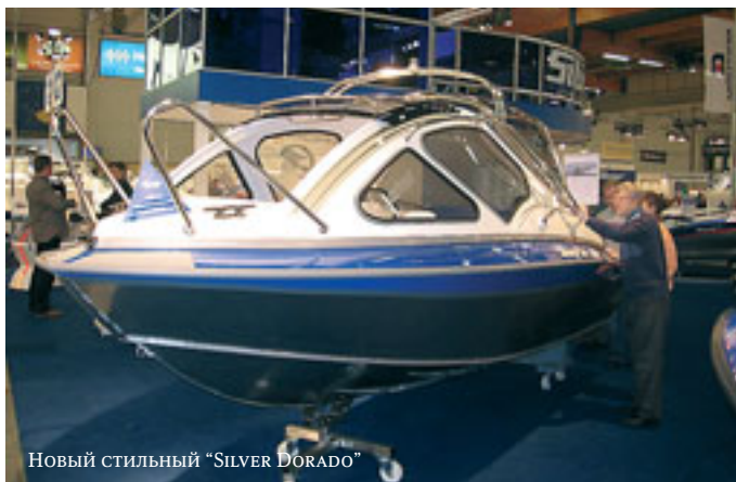
Новый стильный "SILVER DORADO"