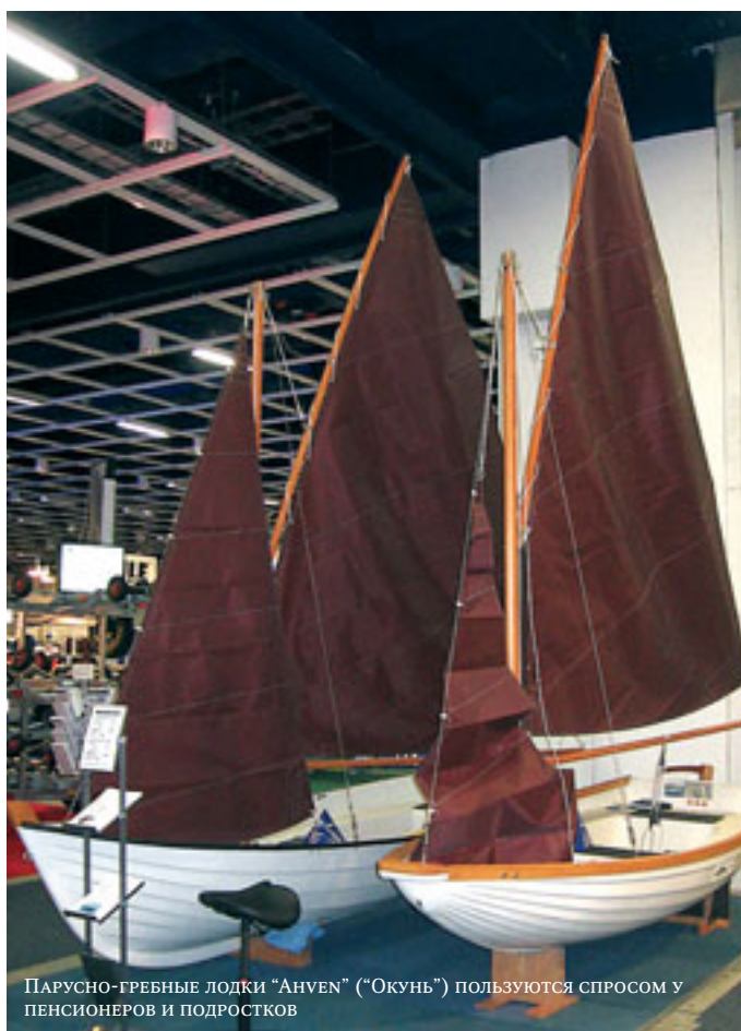
Парусно-гребные лодки "Анвен" ("Окунь") пользуются спросом у пенсионеров и подростков

ного строительства этих высокоскоростных рабочих лодок. Другой экспонат-новинка — самая крупная на сегодня лодка "Мастер-651" производства "Адмиралтейских верфей" — весомо украсил стенд местного финского дилера. Можно считать ее нашим ответом финнам с их "Buster Magnum", возможно, не столь изящным, но, надеемся, не менее прочным и функциональным.