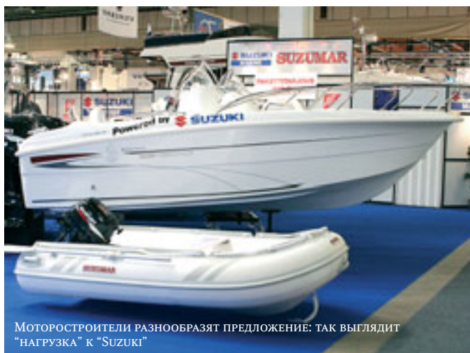
Моторостроители разнообразят предложение: так выглядит "нагрузка" к "SUZUKI"

Довольно заметным было присутствие "постсоветских" экспонентов. Эстония выставила ладно сработанные гребные и парусные деревянные лодки размерами от тузика до рыбацкой шаланды, а также очень прилично сваренные стальные катера. Украинский десант включал давнего клиента международных выставок харьковский "Бриг", а также новичка "UMS-Boat" — продукция бывшего завода "Ленинская Кузница". Алюминиевые лодки "UMS" выглядели вполне конкурентоспособно благодаря тому, что их корпуса сварены не из листа на наборе, а из прессованной вместе с ребрами жесткости панели, что существенно снижает сварочные деформации и способствует созданию добротного внешнего вида. Наших соотечественников представляла Охтинская судостроительная фабрика со своим "пробным шаром" — лодкой "Охта-21". Посещаемость ее стенда должна была дать ответ на вопрос о перспективах серий-