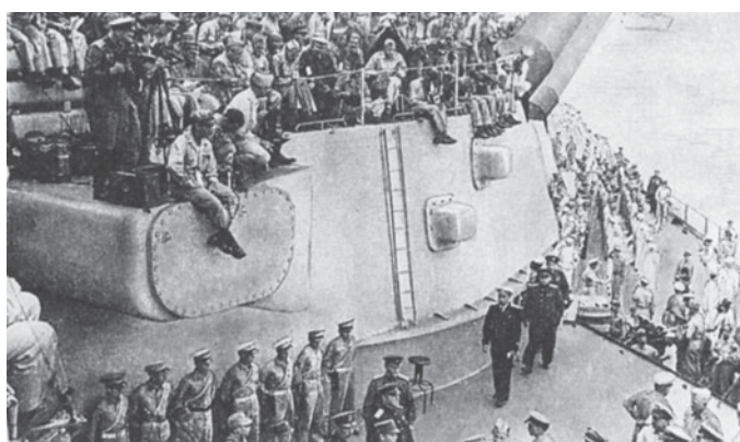
На борту «МИССУРИ» во время подписания акта о капитуляции Японии

что противоторпедные сети американцы считали ненужными. Японские вооруженцы сумели пристроить к существующим торпедам хитроумные стабилизаторы, сделавшие их эффективными и на мелководье.