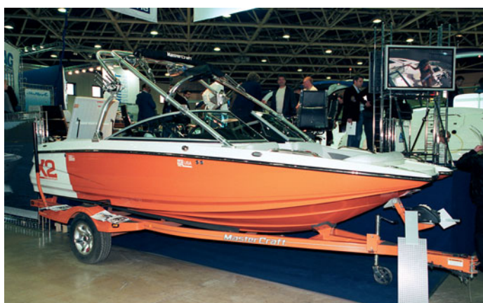
БУКСИРОВЩИК «MASTER CRAFT X2»