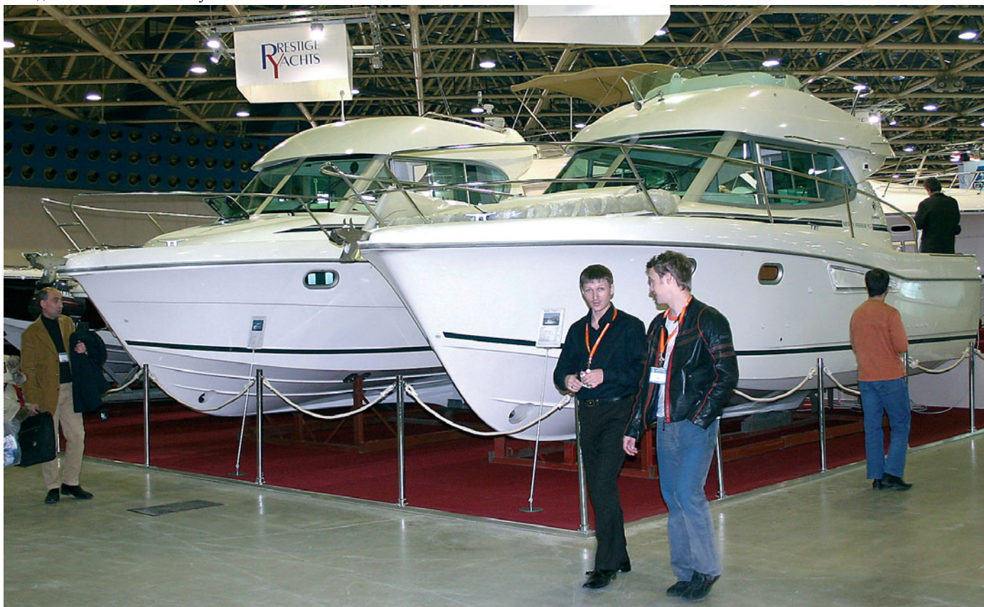
Нарядные «MERRY FISHER» от «JEANNEAU»