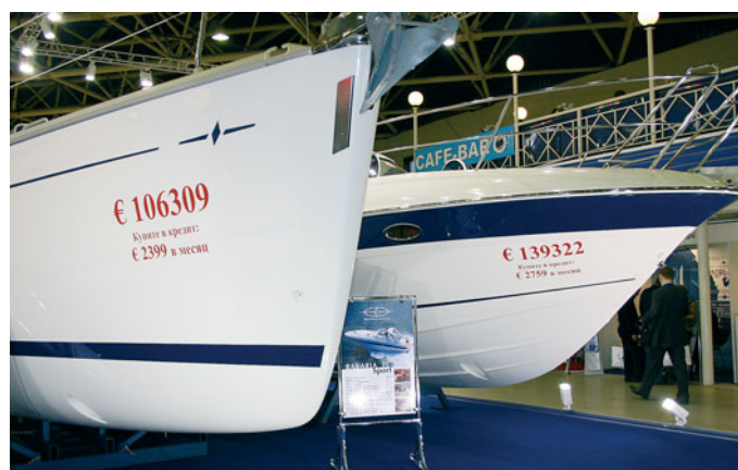
«BAVARIA» И «BMB» ТЕПЕРЬ МОЖНО КУПИТЬ В КРЕДИТ

компанией «MyBoat» (до сих пор существовала только открытая версия), и алюминиево-пластиковая мотолодка «Grizzly», демонстрируемая молодой петербургской компанией «Аква-Трейд». Из «крупняка» наиболее популярного для MIBS диапазона 28–35 футов была представлена единственная отечественная лодка — моторная яхта «Flagship», построенная в Казани.