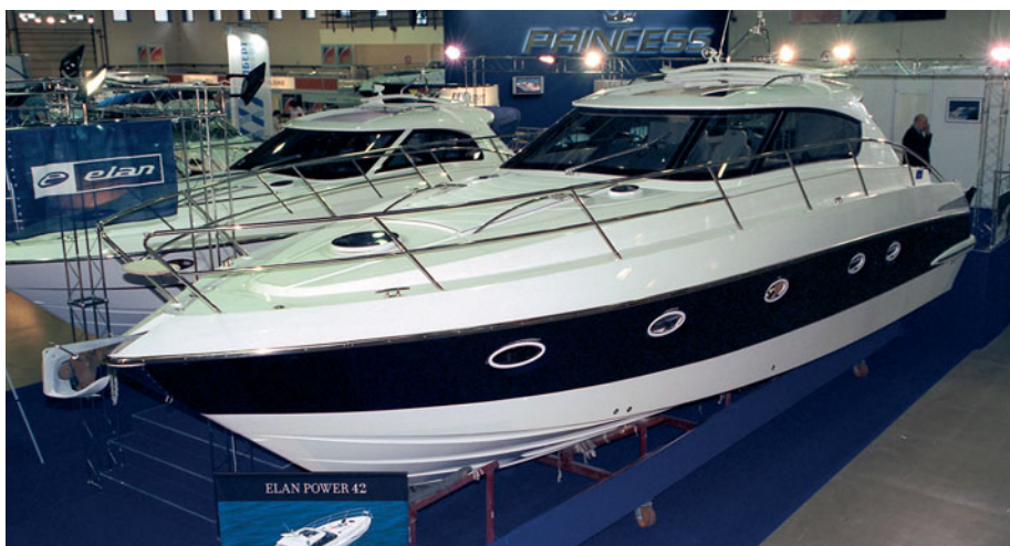
Присутствие моторных яхт «ELAN» на нашем рынке растет — на переднем плане модная ныне «42-я» модель