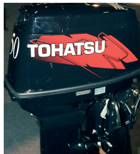
Моторы «Тоhatsu» набирают популярность в России