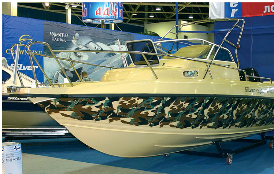
Очередная новинка от петербургской компании «Спортсудпром» — «SILVER EAGLE» с компоновкой «WALKAROUND»

Что же касается итальянцев, то в пору говорить о самой настоящей экспансии. Италия — один из безусловных лидеров мирового «прогулочного» судостроения