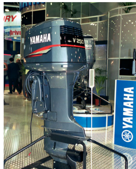
«YAMAHA» выставила широкую гамму своих движков, включая 250-сильную модель