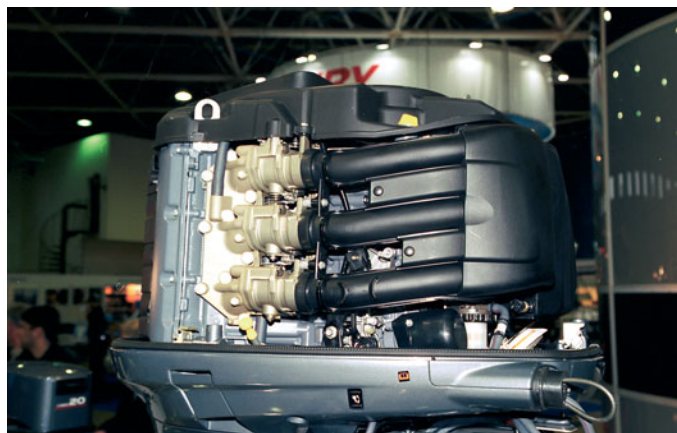
Одна из новых моделей «Mercury»

на наш взгляд, является лишним свидетельством определенного насыщения моторного сегмента российского рынка — люди уже не хотят покупать лодки по принципу «чтобы как у всех».