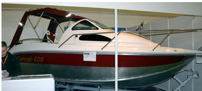
ПЕТЕРБУРГСКИЙ «КОРВЕТ-600» ОБЗАВЕЛСЯ РУБКОЙ