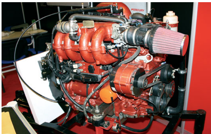
«MerCruiser» по-русски — 150-сильный «волговский» мотор, легко взаимозаменяемый со своим заграничным собратом