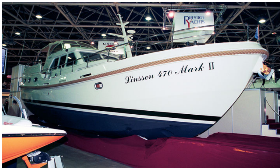
САМОЕ МАЛЕНЬКОЕ И САМОЕ БОЛЬШОЕ ИЗ ВЫСТАВЛЕННЫХ СУДОВ — ГИДРОЦИКЛ «SEA-DOO» И СТАЛЬНАЯ МОТОРНАЯ ЯХТА «LINSZEN 470 MARK II»