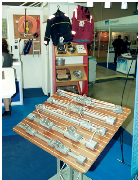
Парусные дельные вещи на стенде птербургской компании «Фодевинд-Регата»