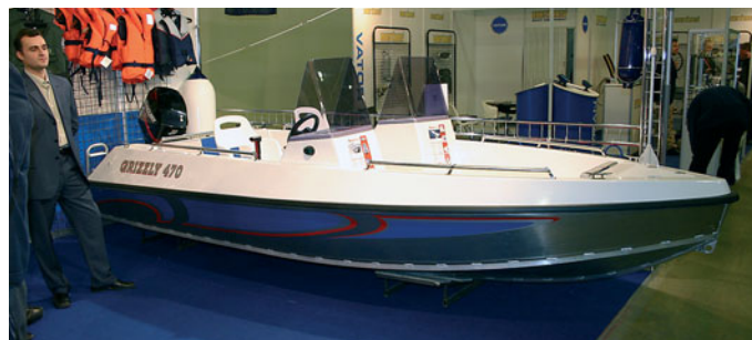
АЛЮМИНИЕВО-СТЕКЛОПЛАСТИКОВАЯ МОТОЛОДКА «GRIZZLY»