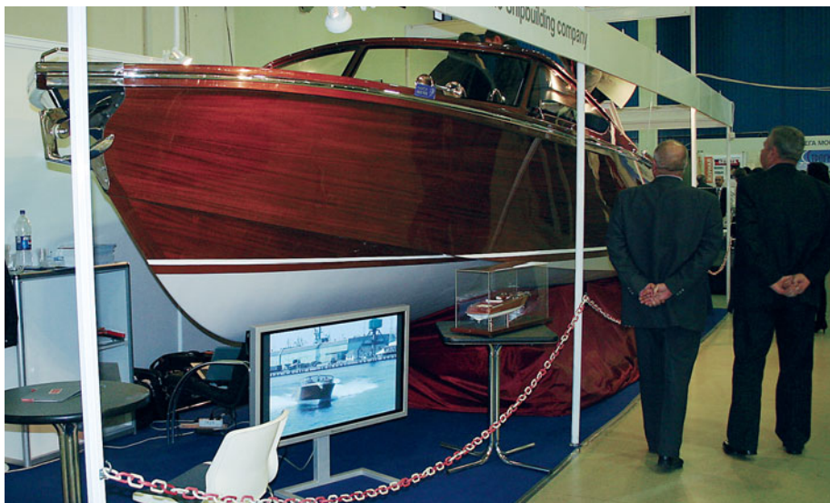
Украинская верфь «LAGOON ROYAL» привезла второй экземпляр моторной яхты-реплики «MARTIN», протестированной на нашей «мерной миле» (см. № 196)