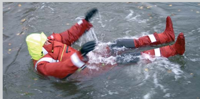
В условиях, в которых проходила рыбалка, огромное значение имела одежда: мы прожили трое суток в непромоканцах финской компании «Suunto», сделанных из дышащей ткани «Goretex». Они специально разработаны для яхтсменов, но, конечно же, вполне годятся и для сложных спиннинговых пассажей. Даже выпав за борт в этом костюме, можно спокойно дрейфовать на волне за счет воздуха, герметично запечатого внутри мембранной шкуры.