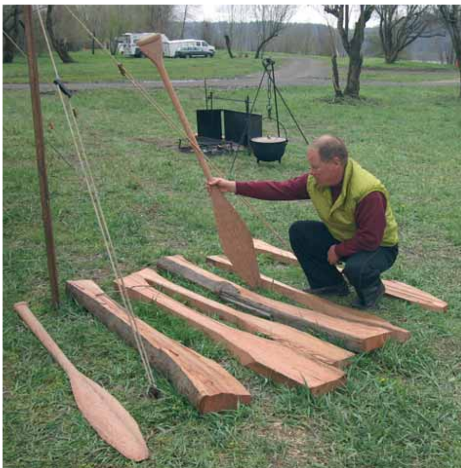
Это весло было сделано на наших глазах