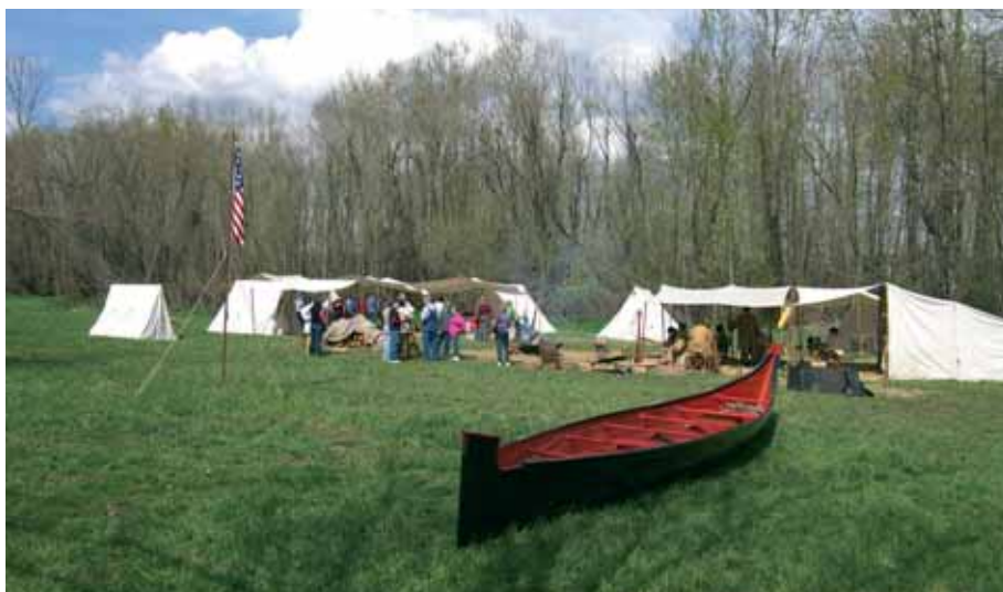
Уже с утра в лагере появляются гости