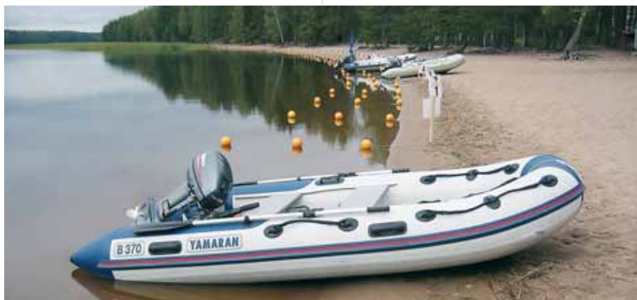
Уютный пляж готов принять участников соревнования

Старту предшествовала квалификация, по результатам которой лодки и уходили в «море». А проводилась квалификация довольно оригинально – команды состязались на время приведения в боевое состояние своих лодок. Здесь