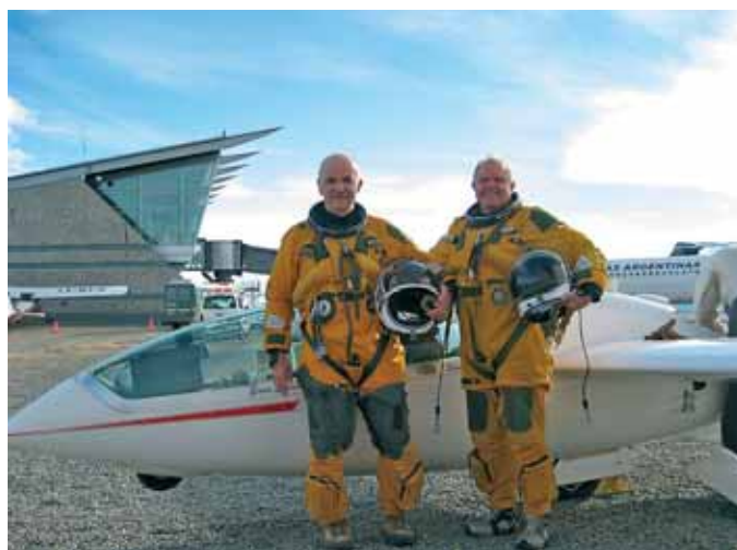
Стив Фоссетт со своим напарником после рекордного по дальности полета на планере

его – Чарлстон: сначала на реактивном, а потом (вернувшись в точку старта) и на турбовинтовом самолете.