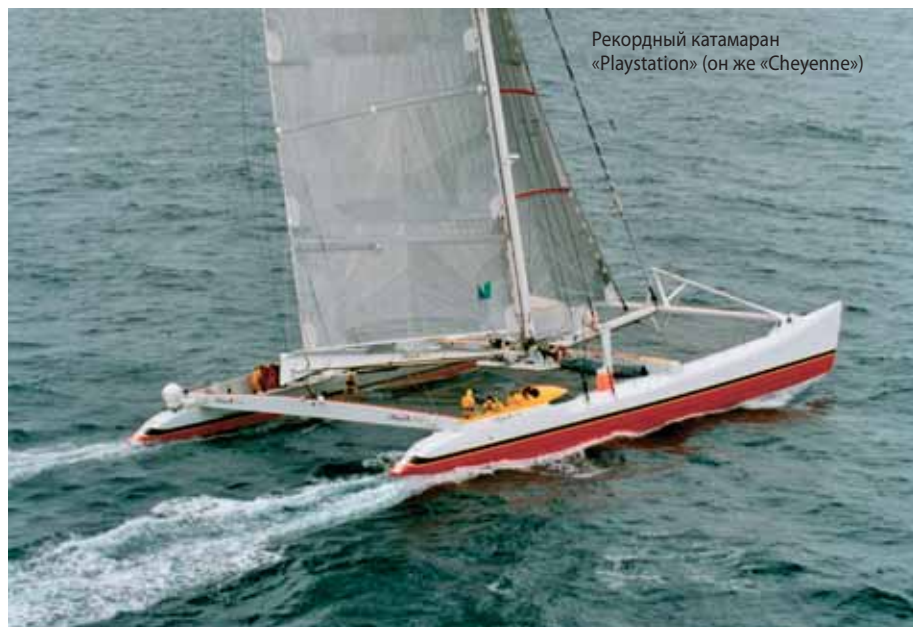
Рекордный катамаран «Playstation» (он же «Cheyenne»)

Стив прошел этапы триатлона (известного также как Ironman Challenge), покорил шесть семитысячников мира (при этом на Эверест поднимался дважды), вплавь пересек Ла-Манш, участвовал в гонках собачьих упряжек на Аляске, совершал многодневные одиночные лыжные переходы по горам Калифорнии. Параллельно с этим он установил множество мировых авиационных рекордов, став одним из наиболее известных пилотов мира. Ему и по сей день принадлежит рекорд самого быстрого полета на дозвуковом самолете – средняя скорость составила 1194.20 км/ч (рекорд был поставлен на самолете «Cessna Citation X»). Характерно, что в один из дней (а именно 5 февраля 2003 г.) Стив Фоссетт ухитрился поставить сразу два авиационных рекорда на одной и той же трансконтинентальной трассе Сан-Ди-