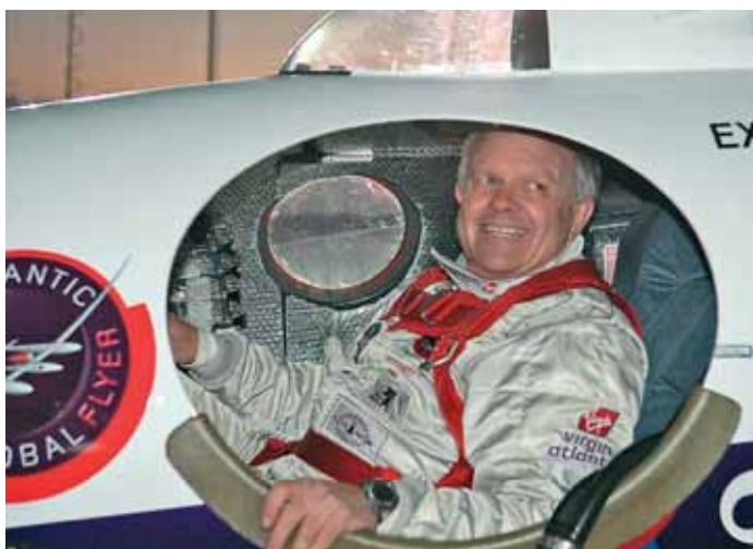
На борту самолета «Global Flyer» Фоссетт облетел вокруг Земли без посадки